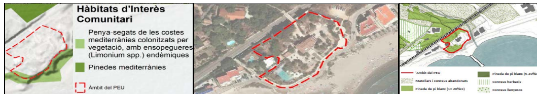
Imatge. Delimitació dels hàbitats d'interès comunitari i dels hàbitats naturals existents

Serveis Territorials a Barcelona Oficina Territorial d'Acció i Avaluació Ambiental