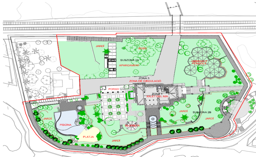
Imatge. Plànol de zonificació

- Zona 3 Accés i camí: es tracta del camí d'accés a la finca, que connecta mitjançant un pont sobre la via del ferrocarril amb el camí de Sant Gervasi. Únicament es preveu mantenir-lo en condicions de manteniment i seguretat correctes.