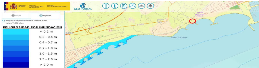
Imatge. Delimitació de les zones inundables d'origen marí

per risc d'inundació d'origen marí, especialment en cas de llevantades, segons la cartografia de zones inundables (T=100 anys i T=500 anys) elaborada pel Ministerio de Agricultura y Pesca, Alimentación y Medio Ambiente .