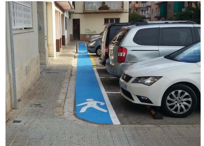
Vorera nord del carrer de Castellet