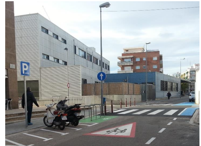
Al carrer de Castellet