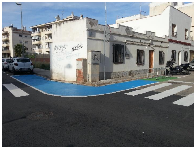
Cruïlla del carrer Castellet amb Canyelles