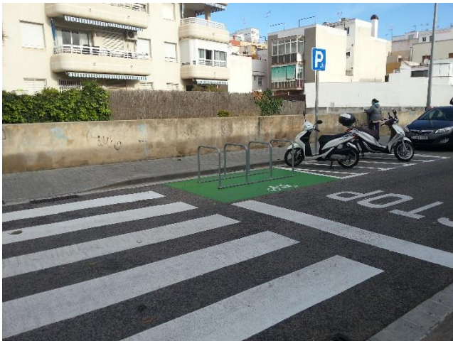
Davant de la porta d'entrada de l'escola Volerany