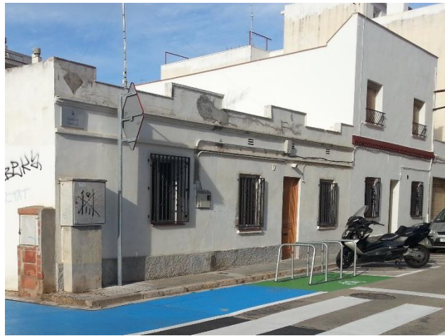
Al carrer de Canyelles