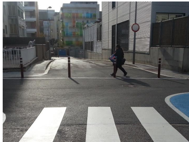
Carrer de Canyelles tallat al trànsit entre c. de Castellet i c. de Ramón y Cajal