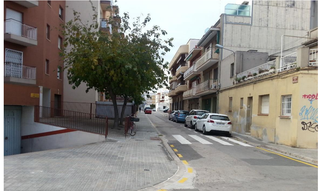
Reordenació dels aparcaments