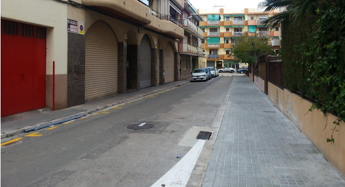
Ampliació de la vorera sud del carrer de Castellet i rebaixos