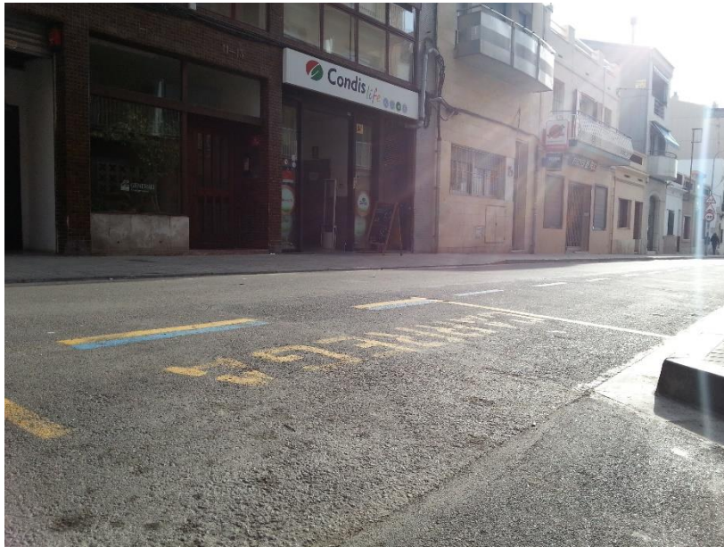
Zona de càrrega i descàrrega