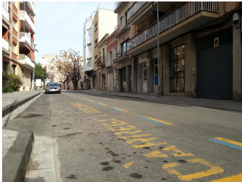
Detall vorera est ampliada