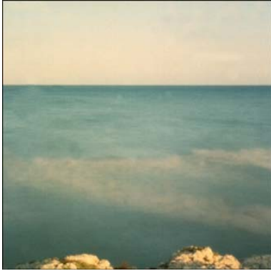
Stenomediterrània #5 Imatge estenopèica 2006