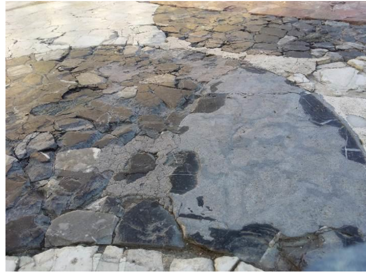
Estat abans de les obres