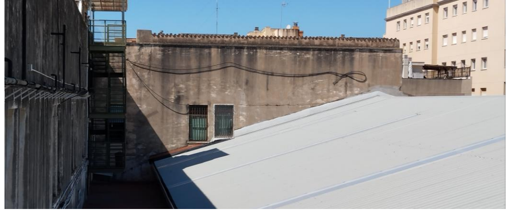
Després de la intervenció