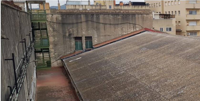
Abans de la intervenció