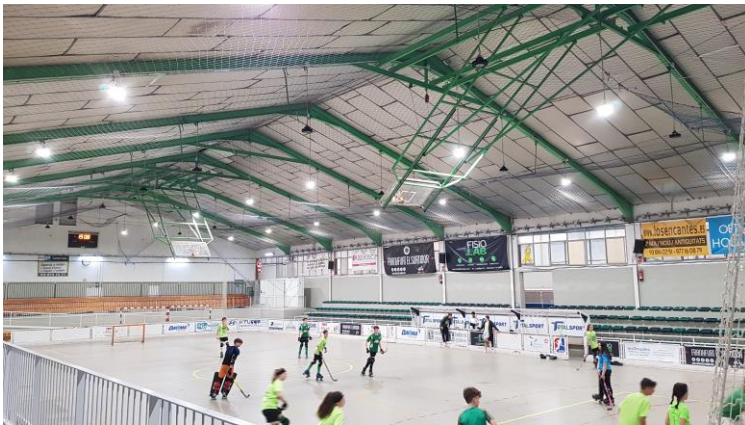
Abans de la intervenció