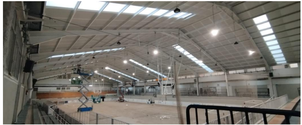
Després de la intervenció