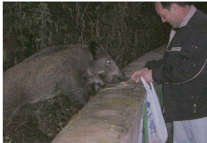
Persona alimentant un porc senglar. Cal vetllar perquè aquests tipus de situacions no es produeixin.

Aquesta pràctica ha d'estar prohibida, tant pels perjudicis que ocasiona als animals, com pels que pot ocasionar a les persones. Els porcs senglars que s'acostumen a les persones hauran de ser capturats i, malauradament, no podran ser retornats al medi natural.