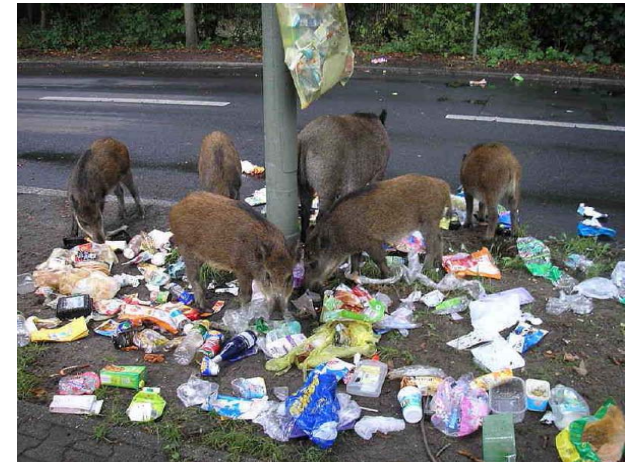
Persona alimentant un porc senglar. Cal vetllar perquè aquests tipus de situacions no es produeixin.