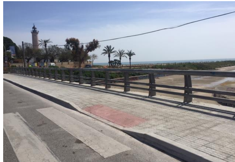
Pas de vianants elevat a l'entrada del passeig del Molí de Mar