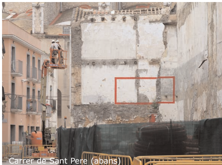
Carrer de Sant Pere (abans)

Una de les principals novetats de la reforma de la paret és la instal·lació de diverses estructures metàl·liques que simulen plantes enfiladisses. Aquestes seran recobertes properament per enfiladisses