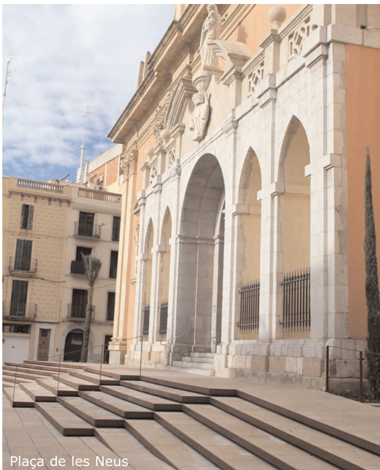
Plaça de les Neus

La nova plaça de les Neus ha guanyat en superfície