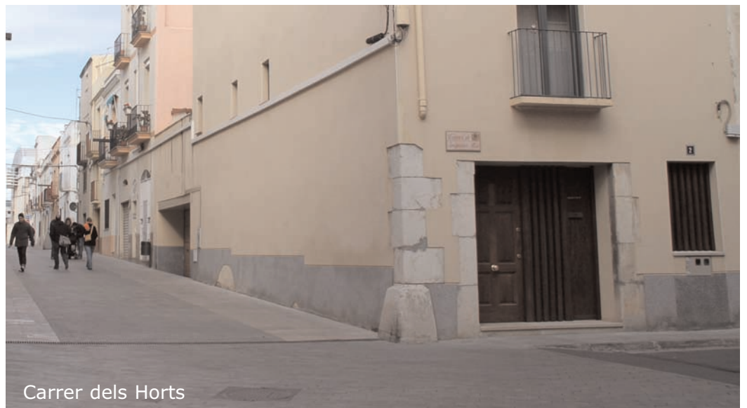
Carrer dels Horts

La reurbanització d'aquest eix ha suposat la supressió del trànsit rodat, l'establiment de zones de càrrega i descàrrega, la pavimentació a un sol nivell, el soterrament dels contenidors d'escombraries, la revisió de l'enllumenat existent, entre d'altres.