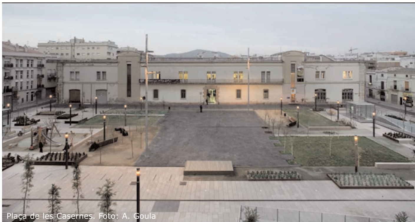
Plaça de les Casernes.

Inaugurada el desembre de 2007, la nova plaça de les Casernes disposa ara d'una superfície de 7.680 metres quadrats i té instal·lada en un dels seus extrems una escultura de l'artista basc Juanjo Novella