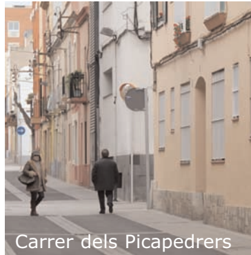
Carrer dels Picapedrers

nants i vehicles per pilones, nova senyalització i nou mobiliari urbà, amb papereres, bancs, jardineres i aparcament per a bicicletes. També s'ha millorat la jardineria, plantes arbustives i el manteniment de l'arbrat existent.