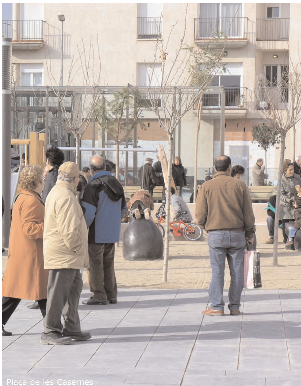
Plaça de les Casernes

El Nucli Antic de Vilanova i la Geltrú havia experimentat en els darrers anys un procés de degradació urbanística, econòmica i social molt important. Alguns dels processos que estaven afectant el barri a nivell social i econòmic eren, entre d'altres, el creixent abandonament del barri tant de residents com d'activitats econòmiques, l'envelliment de la població, l'alt percentatge de nousvinguts, l'alt índex d'atur, el baix nivell educatiu o l'escassetat de serveis per a la ciutadania