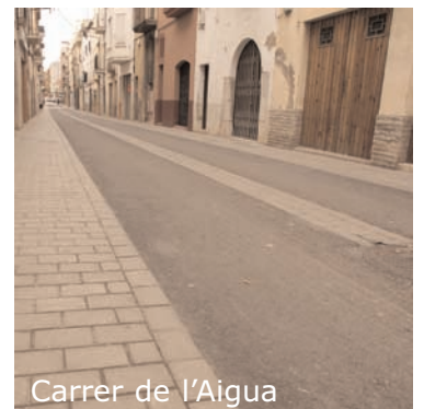
Carrer de l'Aigua

Garí, s'ha mantingut la continuïtat amb el tram ja existent, i s'ha separat la zona de vianants de la de vehicles mitjançant pilones. S'han col·locat nous serveis d'enllumenat i xarxa municipal de reserva. La pavimentació és ara de plataforma única, amb nova senyalització i noves papereres.