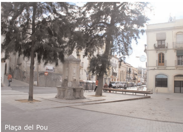
Plaça del Pou

A més, la seva ubicació, a la frontera entre Vilanova i la Geltrú també serà un punt de referència de la reforma. En aquest sentit, s'elevà el paviment en el punt d'unió entre ambdues zones per donar continuïtat.