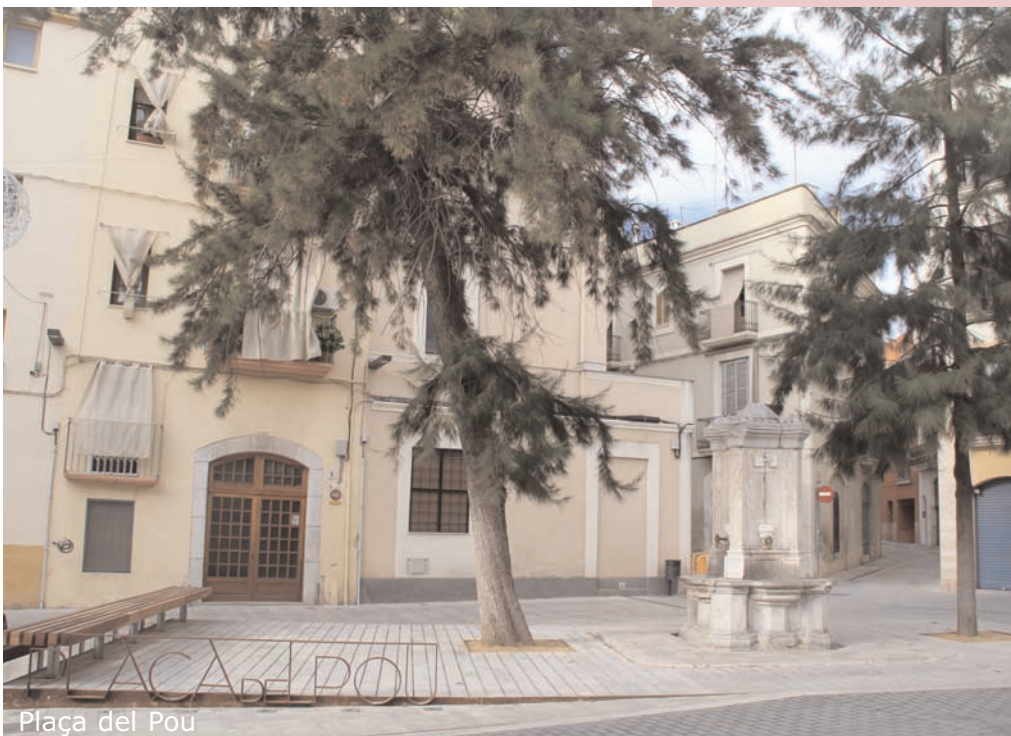
Plaça del Pou