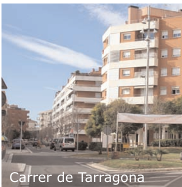
Carrer de Tarragona

Així, doncs, al tram del carrer de Tarragona, entre el carrer del Pare Garí i el carrer dels Estudis, s'ha ampliat el costat sud de la vorera, s'han instal·lat nous serveis d'enllumenat, de reg i xarxa municipal de reserva. S'ha asfaltat i pavimentat tota la calçada i s'ha col·locat nova senyalització, nou mobiliari urbà i contenidors soterrats. També s'ha plantat arbrat i s'ha traslladat la parada de l'autobús urbà.