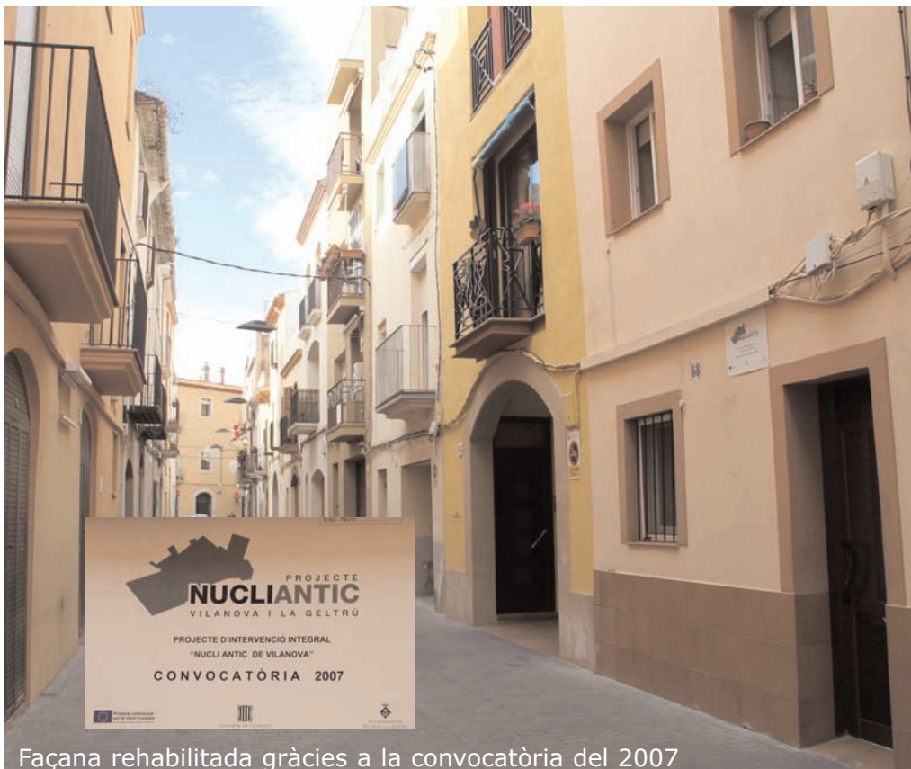
Façana rehabilitada gràcies a la convocatòria del 2007