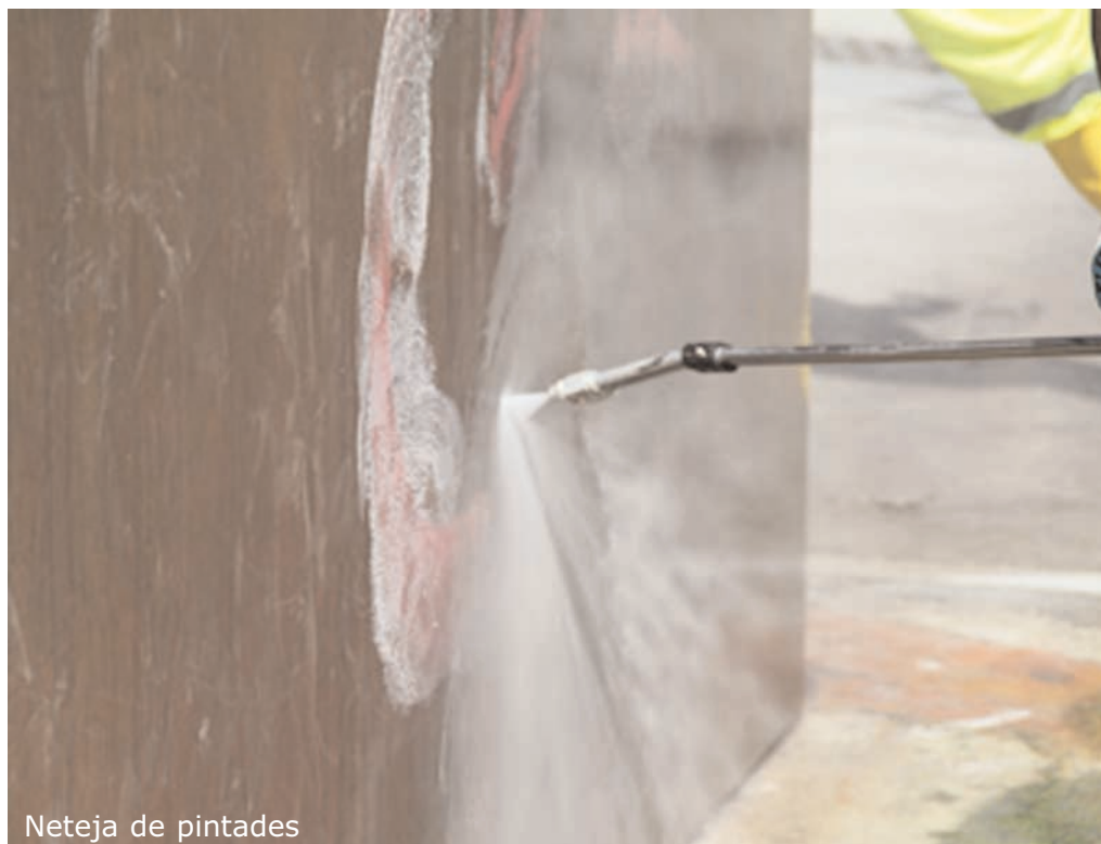
Neteja de pintades