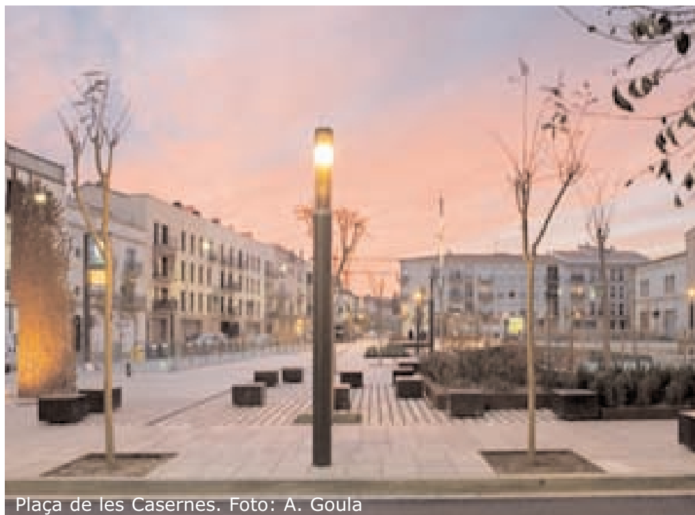
Plaça de les Casernes.

Aquest mes de desembre han finalitzat les obres previstes en el PINA, un projecte que s'emmarca en la Llei de Barris, promoguda per la Generalitat de Catalunya.