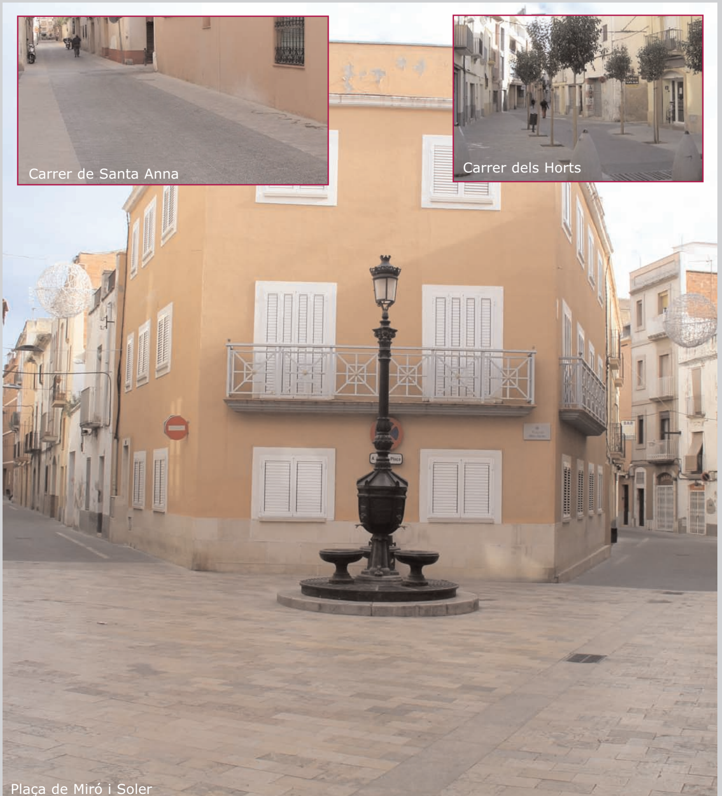
Plaça de Miró i Soler