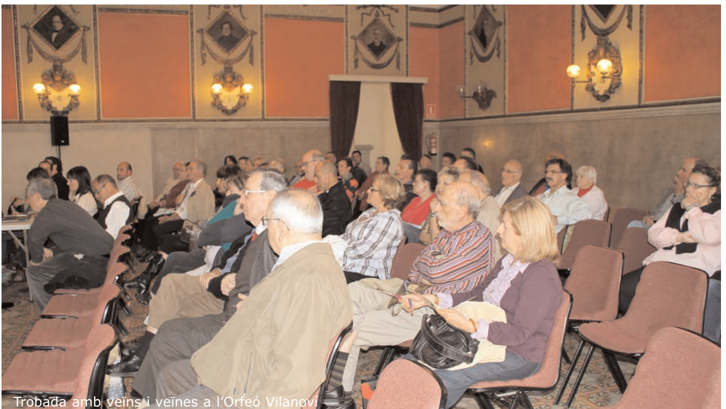
Trobada amb veïns i veïnes a l'Orfeó Vilanoví