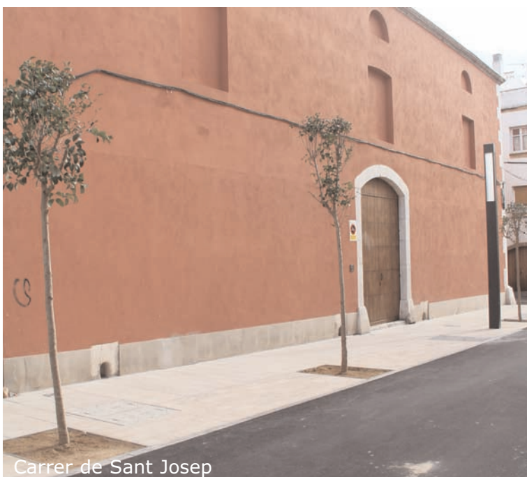
Carrer de Sant Josep

Les obres han consistit en la retirada del paviment existent, el soterrament de la instal·lació elèctrica de l'enllumenat públic i la pavimentació de carrer en plataforma única.