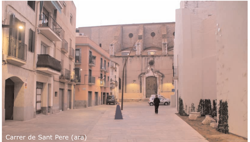
Carrer de Sant Pere (ara)

Amb aquesta actuació, el carrer de Sant Pere s'ha eixamplat, aconseguint així una uniformitat en el seu traçat i una major amplitud a tot el vial, de manera que ara l'església és visible al llarg de tota la via. En aquest sentit, el carrer també ha guanyat en aspecte i seguretat.