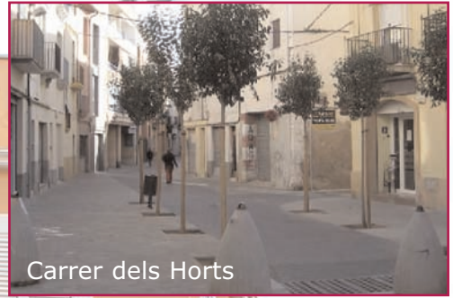
Carrer dels Horts