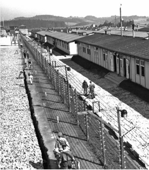
Treballs d'empedrament de l'Appellplatz, on es pot observar la filferada que separa la plaça dels barracots. Quan el 1943 el camp va quedar envoltat per la muralla, aquest filferro electrificat va continuar encerclant un tros de camp interior 1940-1943.