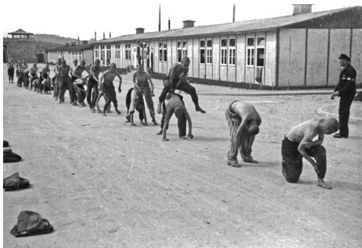
Grup de joves presoners fent exercicis gimnàstics a l'Appellplatz, sota la supervisió d'un "kapo".