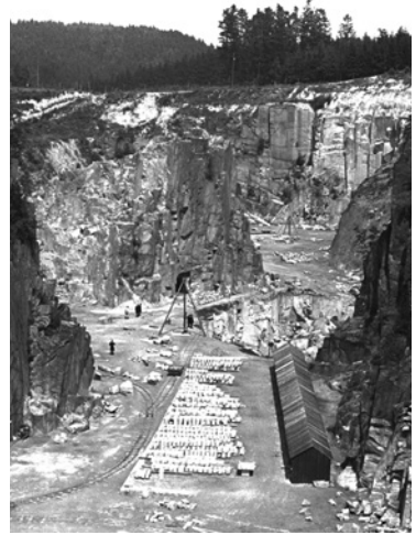
Vistes generals de la pedrera de Mauthausen. A la fotografia, en primer terme, les barraques dels picapedrers. 1941-1942.