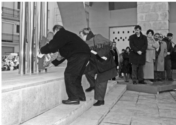
Acte inaugural del monument a la plaça de la Peixateria el desembre de 2001.

Així doncs, aquest estudi local, ha servit per revisar dades, per completar alguns buits documentals, i per tenir una base sòlida per resseguir la vida de cada individu. Un estat de la qüestió prou avançat que permetrà seguir investigant en una recerca que en cap cas es pot donar per closa.