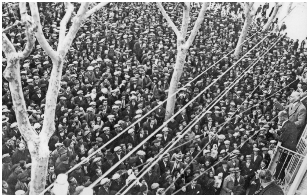
Multitud de vilanovins assistint a un miting de Francesc Macià, a la rambla Principal cantonada amb el carrer del Jardí, on estava situat l'Ateneu Vilanoví, l'any 1931.

Des de la nostra perspectiva, local i nacional, la deportació d'homes i dones als camps nazis esdevingué el darrer graó d'una seqüència històrica que enllaçava perversament República, Guerra d'Espanya, exili i deportació. Aquest nexa, però, no va ser generalitzat, i va dependre de cada cas particular i de les seves circumstàncies. D'altra banda, cap d'aquelles etapes estava predeterminada, ni predestinada, ni tampoc era inevitable, com tendenciosament es va voler fer creure durant la dictadura franquista. Tot plegat fou el producte d'una cadena d'esdeveniments que només es podien entendre en el marc de l'existència simultània en el temps