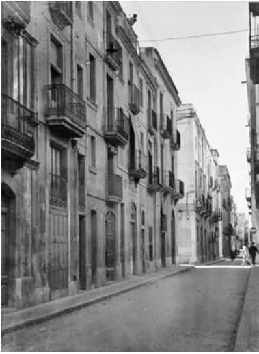
Carrer de Sant Gervasi l'any 1956.

matinada, als 34 anys d'edat, tal com consta al Todfallsaufnahme (certificat de mort) custodiat a Arolsen Archives.