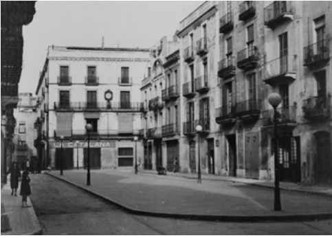
Plaça de les Cols, l'any 1956.

nalitat francesa però en aquest transport es trobaren uns cent setanta presoners de nacionalitat espanyola. Dos dies després, feia entrada al camp de Dachau amb matrícula 74196, on morí el 6 de març de 1945. Ill Vidal apareix en el llistat de morts al camp de Dachau que publicà Montserrat Roig, el 1977.