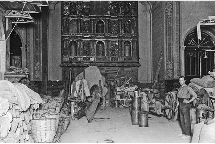
Església parroquial de Santa Maria de la Geltrú quan fou col·lectivitzada, el 1937.

El gruix dels que passaren a França foren reclosos en camps de refugiats de la Catalunya Nord com Argelers, Barcarès, Agde, el Voló, Sant Cebrià i d'altres, en condicions precàries i on no sempre foren tractats amb el respecte que mereixien.