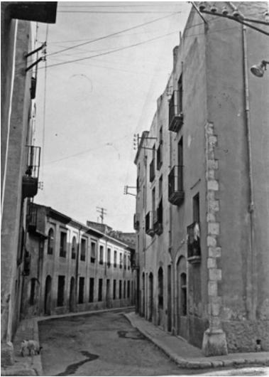
Carrer de Sant Felip Neri, l'any 1957.