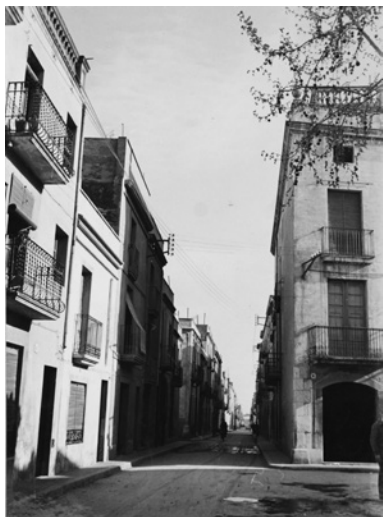
Carrer del Correu el 1957.