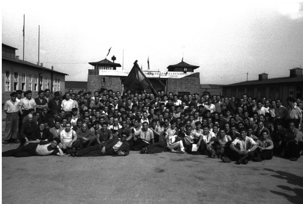
Grup de republicans supervivents a l'Appellplatz, davant les torres d'entrada. Per damunt dels seus caps oneja una bandera republicana.