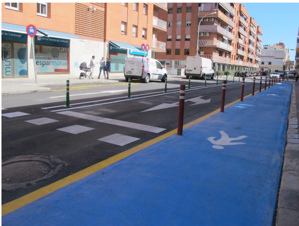
Asfaltat, senyalització i pacificació al c. de l'Havana

La rambla Samà és un eix viari important de la ciutat i la cruïlla amb el carrer de l'Havana estava en mal estat degut a l'afluència de trànsit. S'ha asfaltat aquesta cruïlla i els trams adjacents dels carrers per millorar-ne la seguretat i assegurar la seva correcta funcionalitat i durabilitat. Alhora s'han realitzat treballs de pacificació al carrer de l'Havana, ampliant la zona per a vianants amb pintura blava i pilones protectores tocant a la vorera de mar.