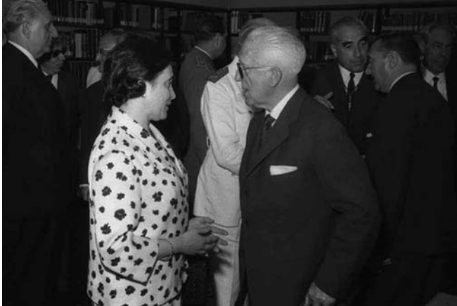
Castell de la Geltrú, 4.VIII.1961 – Inauguració sales d'arqueologia. (AHC, Fons Mas)