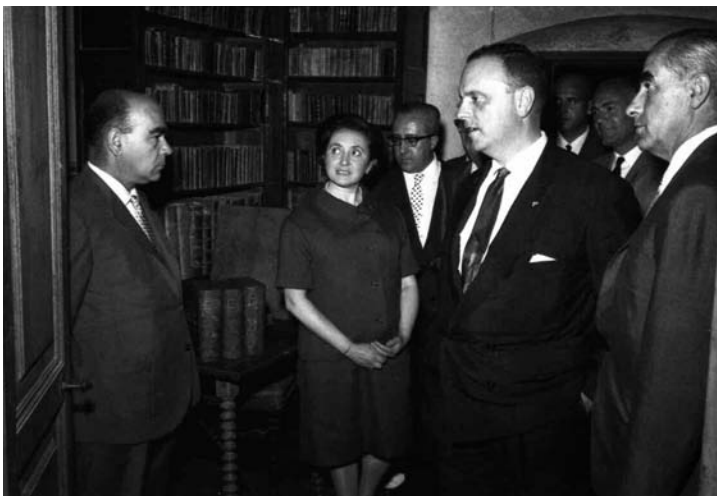
Can Papiol, 29.VI.1966 –Visita de M. Fraga Iribarne, ministre d'Informació i Turisme

Pel que fa a la biblioteca, molt poc després d'haver arribat, el març de 1949, obre el préstec de llibres i inclou uns matisos en el reglament que suavitzaven la cruesa de les condicions per accedir-hi ja que la sol·licitud havia de venir avalada por un Miembro del Patronato de la Fundacion, por un facultativo del Cuerpo de Archivos, bibliotecas y museos, por las autoridades civiles, militares y eclesiásticas de Villanueva y comarca o bien por los directores de los Centros de enseñanza oficial o privada . La segona condició ens fa pensar, doncs, en la mà de la senyoreta davant la impossibilitat real de complir amb els requisits oficials establerts. Ara bé, el valor intrínsec d'aquesta normativa és que mostra la fotografia exacta de la situació que vivia Vilanova i la Geltrú. Poc abans —i cal remarcar-ho clarament pel que té de significatiu— ella feia publicar al diari la notícia que tenia diners per comprar llibres i demanava als lectors que fessin suggeriments de títols.