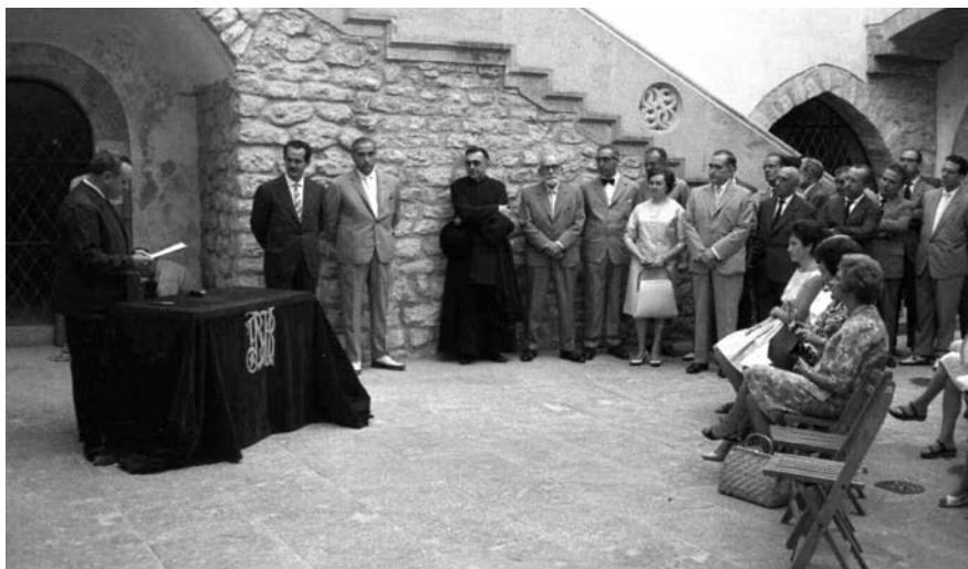
Castell de la Geltrú, 4.VIII.1961 – Inauguració sales d'arqueologia.

Va confiar-me el desig amagat d'anar als balls de mantons i, sobretot, de sortir a la Comparsa. Fou ella qui em va incitar a incorporar-m'hi com a mitjà d'integració.