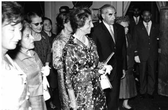
4.VII.1966 Visita de Carmen Polo de Franco a la casa Papiol

La transformació que es vivia en la Institució era total, ja s'ha dit, i ella n'era la responsable de l'execució. És ella mateixa qui ens dóna la cronologia en l'informe que va presentar a la Junta de Patronat arran de l'habilitació de la futura Sala Greco per a l'instal·lació de La Anunciación l'any 1966 després de ser exposada a Nova York. La primera fase es va fer, diu, entre 1950 i 1951 (Sala Pinacoteca); l'any 1964 es reformà el Salón María que es va partir en dos pisos (actualment sala d'exposicions temporals a baix i informalistes a dalt). L'any 1965 s'inaugura la biblioteca de la plaça de la Vila. L'any 1966 es va transformar la sala de ceràmica en Sala Greco. Aquell any i havent millorat les condicions de seguretat, es creu oportú traslladar les pintures del Museo de Prado que eren al Castell a l'edifici fundacional. La ceràmica va desplaçar-se al Castell.