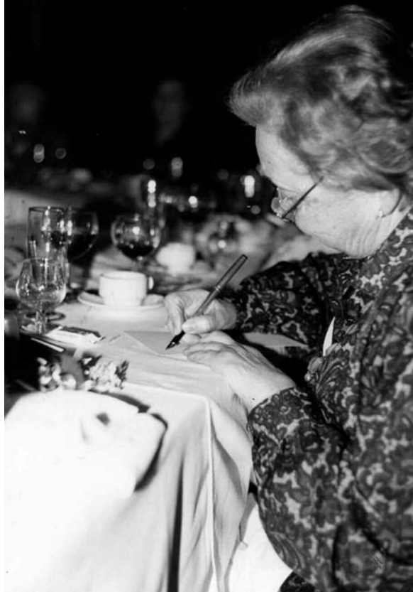
Casa Santa Teresa. Després del sopar de jubilació amb els companys de la Biblioteca Museu Víctor Balaguer. Novembre 1988