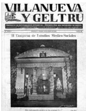
Portada del Diari de Vilanova arran del II Congrés d' Estudios Medico Sociales. 19.X.1957