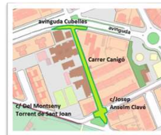
Plànol de situació