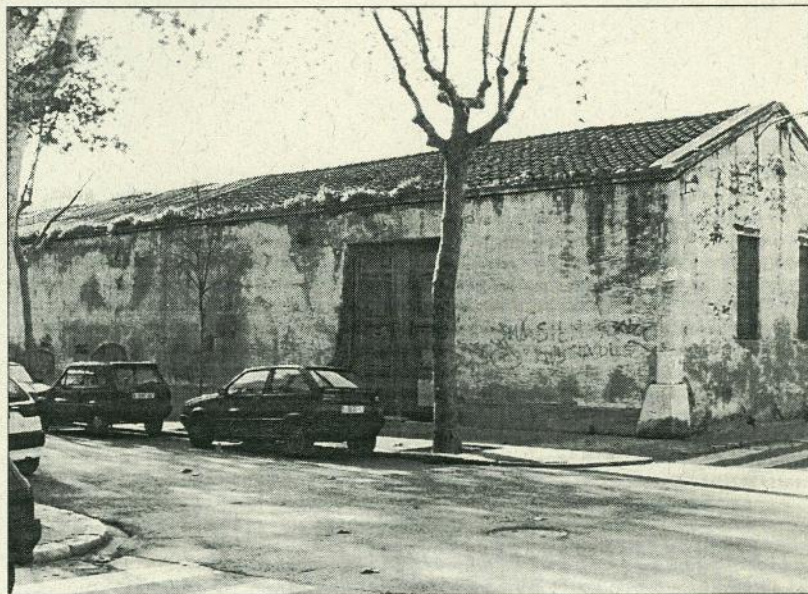
El magatzem vist desde fora. Serà enderrocat per fer-hi pisos

Pons: “Els beneficis no pujaven i els costos sí, per això vam tancar”