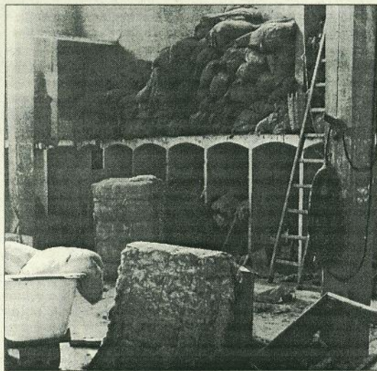
El magatzem del drapaire. Retrat d'un temps pretèrit