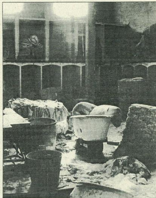
Vista interior del magatzem. Deteriorat pel pas del temps