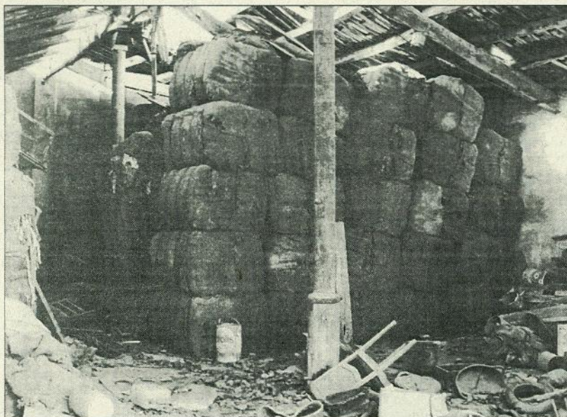
Bales velles de roba i altres materials. Un cop reciclats i embalsats, es venien a empreses

Davant d'aquesta lògica inqüestionable, negar que la de drapaire sigui una professió a extingir és anar contra el sentit comú. Pons té clar que és llei de vida i que no s'hi pot fer res, però potser sí que s'hi pot fer alguna cosa: recordar a través del periple d'aquesta empresa la història d'una Vilanova que, no fa pas gaire, vivia d'una manera molt diferent de l'actual.