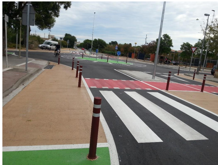
Eliminació de semàfors i senyalització acurada en els encontorns de la rotonda