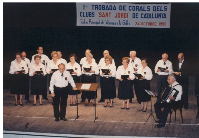
Dirigint el Club Sant Jordi de Vilanova, en la primera trobada de corals dels Clubs Sant Jordi de Catalunya, el 24 d'octubre de 1990