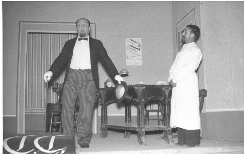
L'any 1960, al Catòlic, en una representació teatral