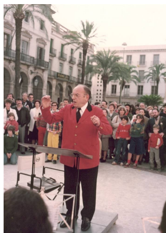
Dirigint la Banda Puig, en un concert de Santa Cecília a la plaça de la Vila el 27 de novembre de 1983