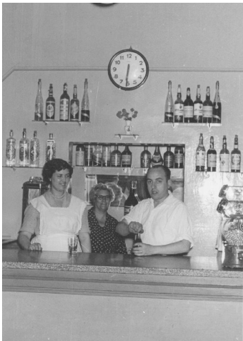
A la barra del cafè del Catòlic