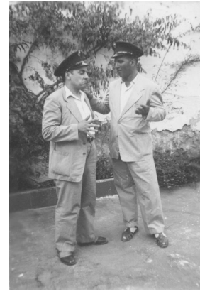
L'Oscar, a l'esquerra, quan treballava de sereno