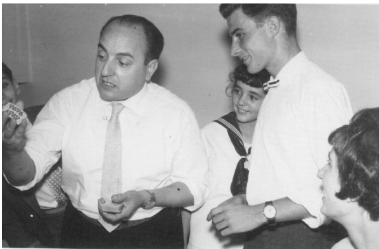
L'Oscar fent jocs de mans en un casament.