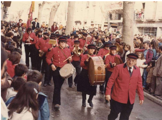
La Banda Puig en els Tres Tombs de 1982