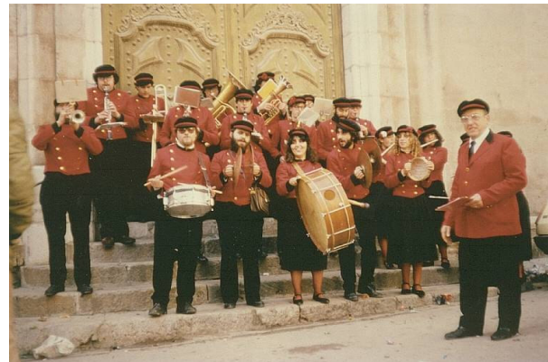
La Banda Puig en el Carnaval de 1981