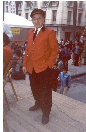
Amb el vestit de la Banda Puig, en el concert d'inauguració del teatre de L'Estaquirot, el 28 de març de 1981