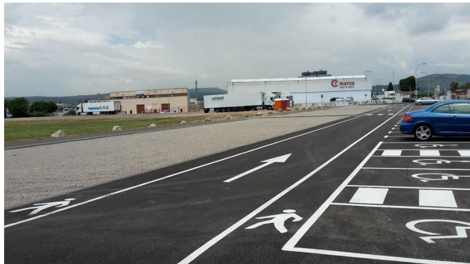
Aparcament construït la primavera del 2018