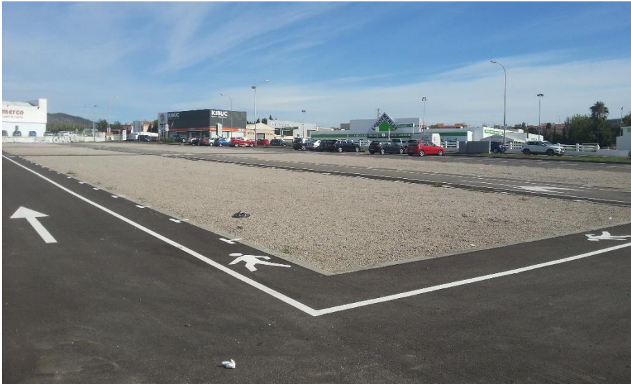
Zona ampliada vista des de dues perspectives diferents