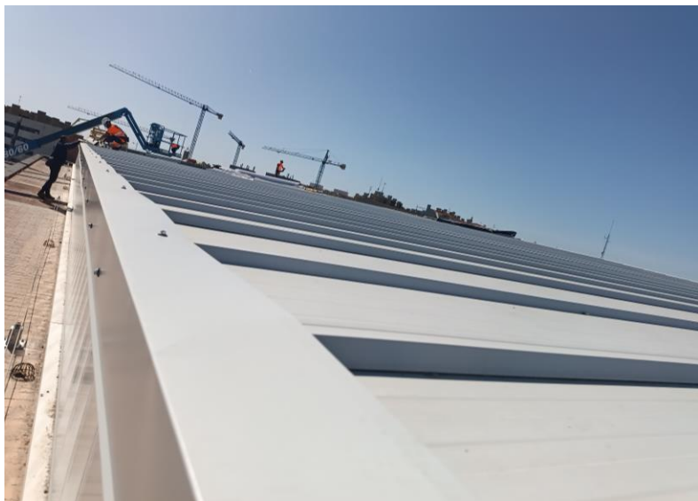
Després de la intervenció