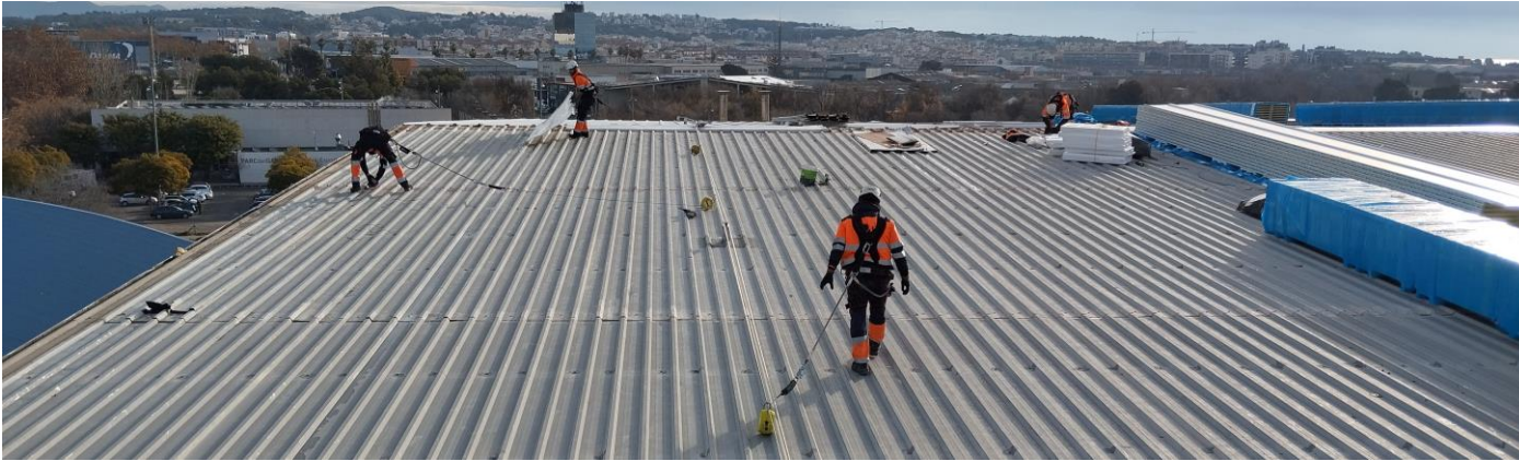
Abans de la intervenció