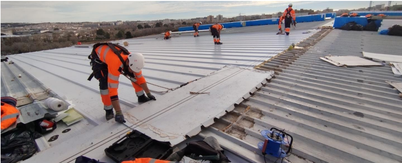
Durant la intervenció