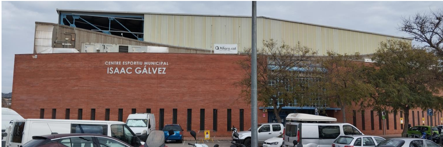
Abans de la intervenció