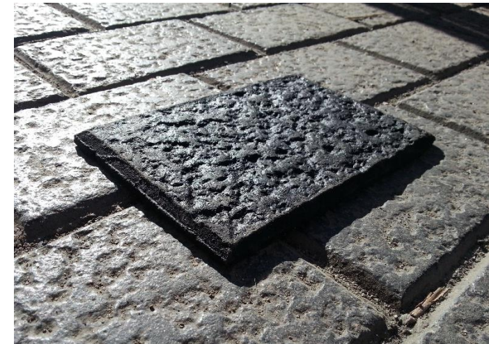
Paviment asfàltic especial en «forma» de llamborda