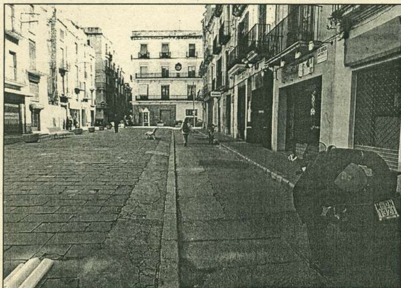
Els projectes de revitalitzar la plaça preveuen, possiblement, convertir-la en zona de vianants