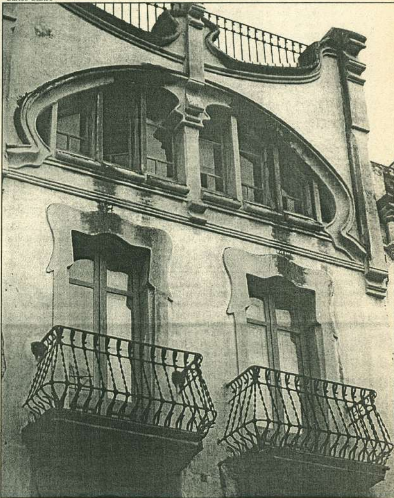
La façana de la Casa Olivella culmina amb aquesta balconada