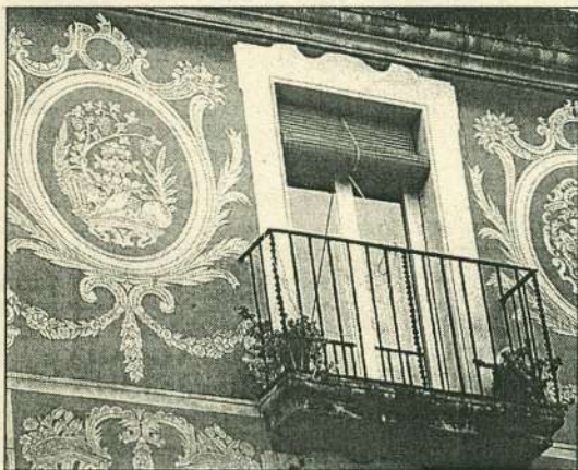
Un dels esgrafiats de la casa Galceran

ments singulars de la casa destaca el bon estat de les pintures interiors i la composició general de la façana. El primer ús de la casa era per habitatge unifamiliar, quan Llorenç de Cabanyes la va fer construir a finals del segle XVIII. Aquest habitatge, fet pel pare del poeta Manuel de Cabanyes, s'ha convertit —com altres cases de la ciutat— en una mostra de les grans residències urbanes de les famílies benestants de l'època, molt vinculades generalment al comerç de productes agrícoles, sobretot a la vinya. La casa té façana a la plaça de les Cols i al Carrer del Comerç i en destaquen la comisa i uns característics ulls de bou el·líptics. Malgrat els diferents usos al llarg dels anys, es conserven bé les pintures a les parets i els sostres de l'època. Els motius mitològics i religiosos, que dominen les decoracions neoclàssiques fins el 1830, s'hi troben amb abundància.