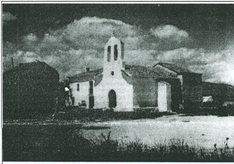
L'ermita de Sant Joan

Així mateix, afegí que aquest esforç s'està portant a terme en viles amb poca capacitat de gestió i que, per tant,