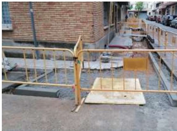
Execució ampliació vorera ↑