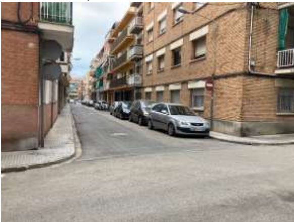
Carrer de Josep Pers i Ricart abans de l'obra ↓