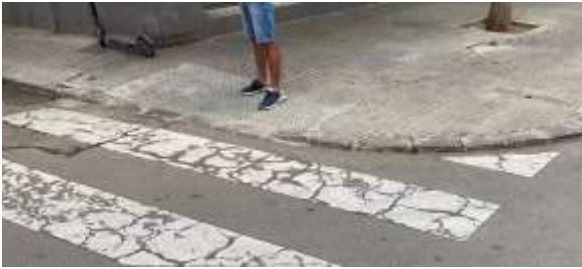
C. de Cristòfol Raventós amb rambla del Castell ↓