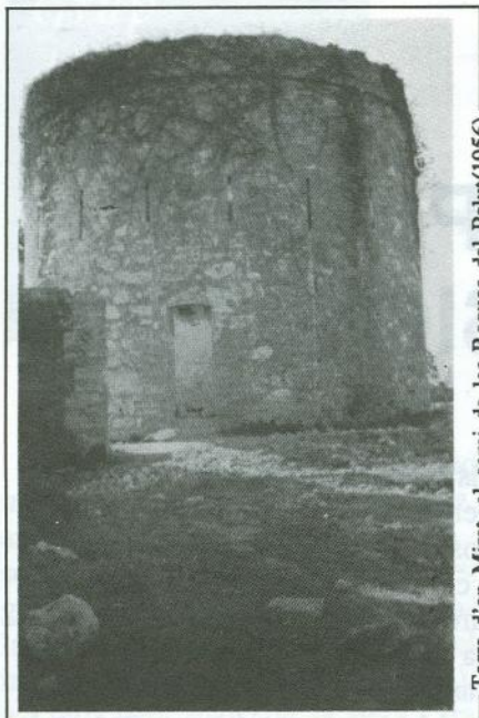
Torre d'en Mirret, al camí de les Roques del Pelut (1956)

la van "batejar" com a "Granja La Villanovesa". L'actual propietari, el Sr. Ricard Farràs, ha sabut conservar-la de l'impuls constructor i li ha donat vistositat i perspectiva.