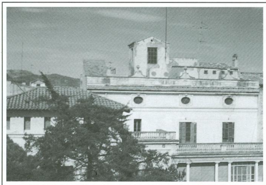
Vista de la casa Maristany per la part posterior.

Els sostres són alts amb les parets esgrafiades amb di-