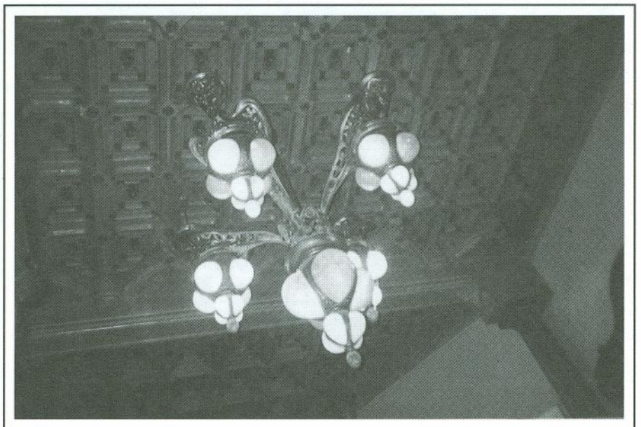
Casa Maristany. Làmpada del menjador.