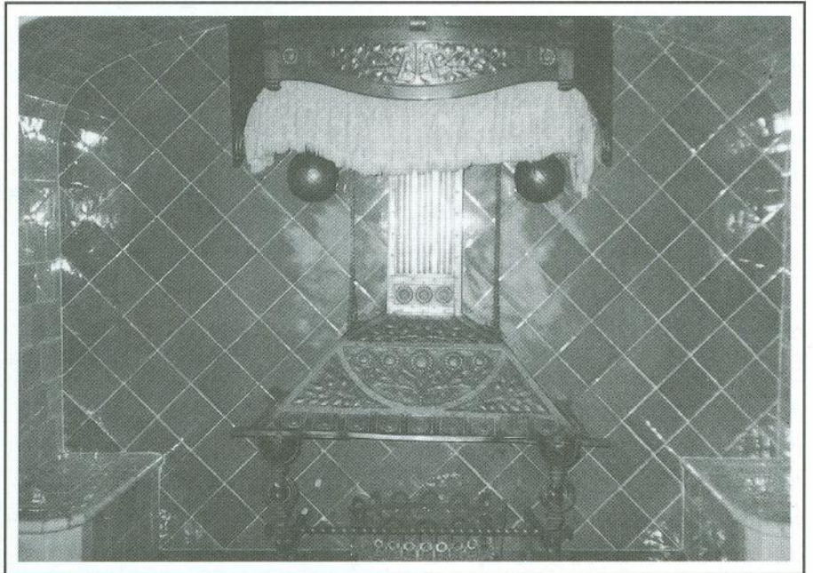
Escó del foc a terra del gran menjador.

Els antecessors dels actuals propietaris, des que es va convertir aquesta casa en Maristany, van deixar la dependència econòmica que tenien basada en l'agricultura i van passar al negoci del cotó i del teixit amb una fàbrica a Margrat de Mar, fins a l'arribada de la decadència tèxtil dels nostres dies, quedant la casa des de fa molts anys com a segona residència.