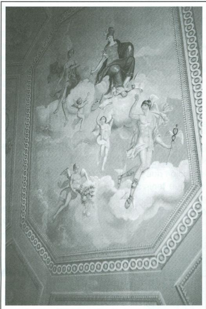
Sostre d'habitació de la casa Maristany.