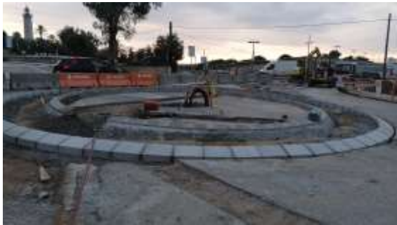
Protecció d'arbres i palmeres ↓