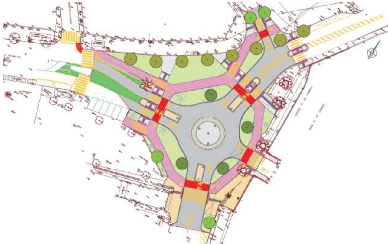
Plànol rotonda Joan Oliver. Proposta ↓