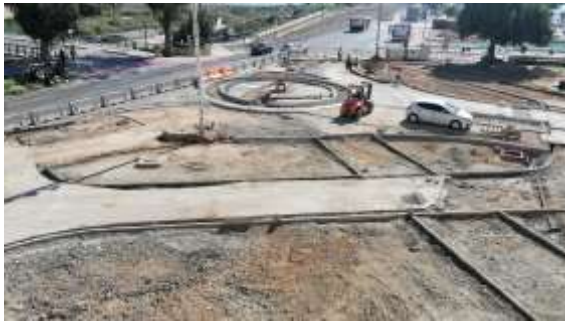
Desplaçament i creació d'embornals ↓