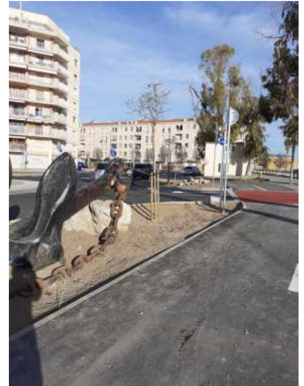
Visió des del far ↓