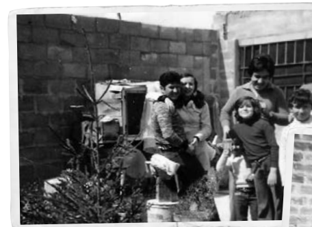
Les construccions dels habitatges es feien en família.

Veïns i veïnes van aixecar un barri del no-res i ho van fer amb les seves pròpies mans. I això no és només una proclama, és una realitat en la construcció d'un barri obrer. I és que una casa, per modesta que fos, en aquell moment ja representava una despesa important, així que després de pagar l'arquitecte i l'aparellador que donés el vistiplau a l'habitatge, les famílies optaven per fer-se càrrec personalment de la construcció de la casa.