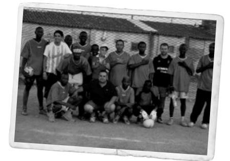
Participació de membres de diversos orígens, principalment de l'Àfrica Negra, als anys 2000