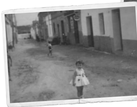
El carrer de la Fuensanta, entre la plaça del Sol i el carrer dels Crespellins. Al fons, el bar David.