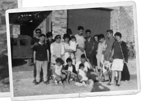
Famílies Arenas i Robles. Foto: Francisco Robles