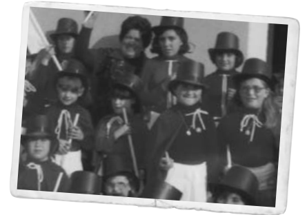
El grup de majorettes del barri, als anys 70 i 80.