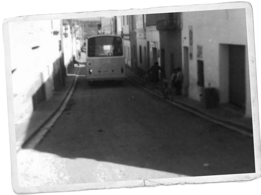
Un dels primers autobusos que van passar pel carrer de la Fuensanta.

La línia de bus urbà tenia escassament un any, i aquesta prolongació va ser una de les acomodacions de la mateixa. Des d'aquell moment, el final de la ruta del bus urbà va ser l'esplanada de la fàbrica Griffi i es complia així una de les primeres reivindicacions del barri.