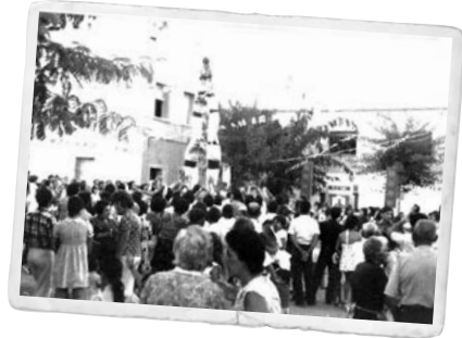
Escenes de la Festa Major del barri, als anys 70

Amb l'aparició de l'Associació de Veïns del Tacó, l'any 1979, tot just amb l'arribada de la democràcia, l'organització de la festa va recaure en l'entitat, que concentrava la major part de les activitats a la plaça del Sol i el carrer de València. Llavors, l'Ajuntament també col·laborava econòmicament amb la festa, uns diners que se sumaven al dels veïns i veïnes i d'alguns negocis del barri per poder fer un ampli programa d'activitats que incloïa des de balls, a competicions esportives, xocolatades populars i altres propostes per a tots els públics... Aquesta voluntat de reafirmar la pertinença a una barri, a una ciutat, va donar un impuls a totes les festes de barri que amb la seva celebració cercaven la seva identitat i la diferenciació i descentralització d'una Festa Major de Vilanova que encara no havia agafat el protagonisme i la consolidació que viu actualment.