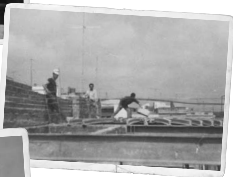
Detall de la construcció d'un dels habitatges del barri