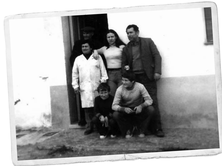
Escenes familiars del veïnat del barri.