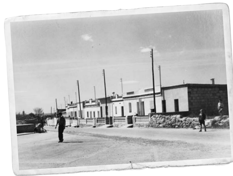
Imatge de la carretera de Vilafranca, des de l'esplanada de la cimentera Griffi.