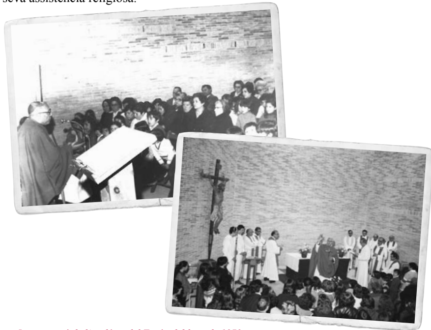
Inauguració de l'església del Tacó, al febrer de 1979