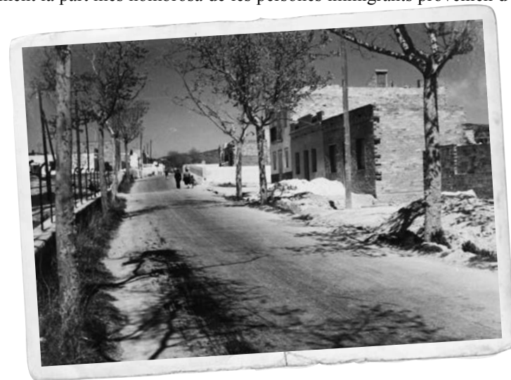
Imatge de la carretera de Vilafranca, entre els carrers de Sevilla i de la Fuensanta.

Tot i que des dels seus inicis, les primeres persones residents van voler retre homenatge als seus orígens i van batejar el barri amb el nom del Barri de la Fuensanta , a la resta de la ciutat ràpidament se'l va conèixer amb el nom de Múrcia Xica , ja que al "nou veïnat vilanovi" se'l coneixia popularment com a murcians perquè inicialment la part més nombrosa de les persones immigrants provenien d'aquella