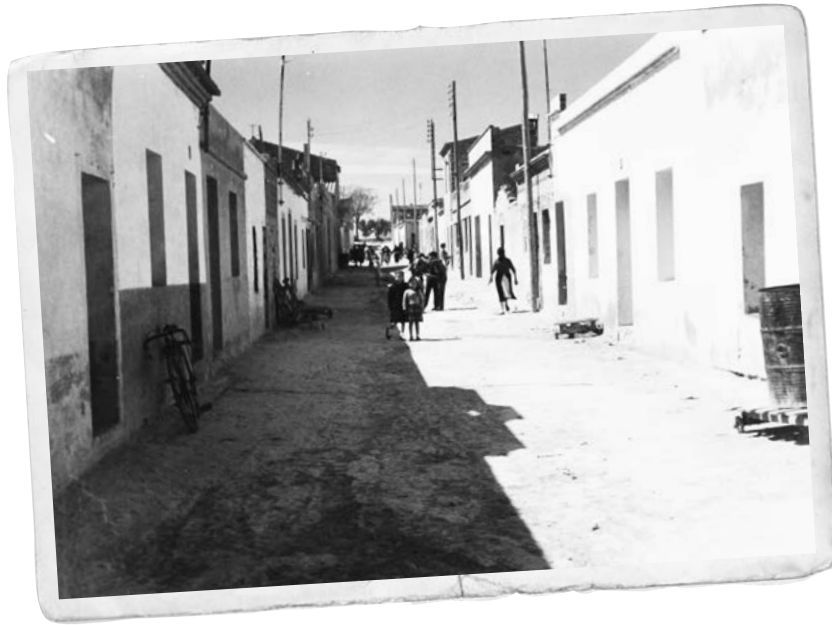
Imatge del carrer de la Fuensanta des del carrer dels Crespellins