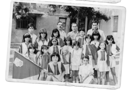
Escenes de la Festa Major del Tacó 1972, que va coincidir amb la inauguració de la urbanització dels carrers.