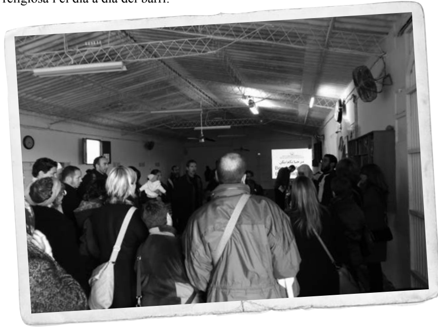
Imatge de l'Oratori del carrer dels Crespellins

concentració i vetllar per la seva integració. I sobretot ens va molestar que no es comptés amb nosaltres per traslladar l'oratori des del barri de Mar fins al carrer dels Crespellins, precisament perquè s'havia arribat a aquest compromís amb el veïnat de l'anterior ubicació". Tot i així, Villa destaca que tret d'algun cas concret, no hi ha hagut problemes de convivència entre l'activitat religiosa i el dia a dia del barri.