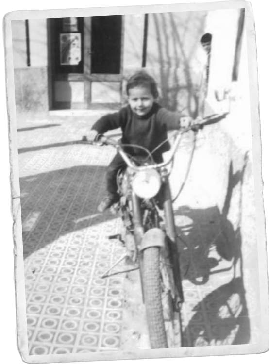
Al fons el forn de pa de la plaça del Sol.

molt dura, perquè treballes tots els festius, els caps de setmana, el fet d'haver d'abandonar la taula en una celebració familiar per començar a preparar els xurros i obrir la botiga és molt sacrificat. Però que encara hi hagi gent que em digui que no han trobat uns xurros tan bons com els meus i que els proveïdors i els clients encara se'n recordin de mi és molt bonic ". I és que la xurreria va ser una bona carta de presentació del barri i són molts els que reconeixen que el primer cop que van trepitjar el Tacó va ser un matí de Cap d'Any o l'endemà d'una revetlla per menjar una bona tassa de xocolata amb xurros.