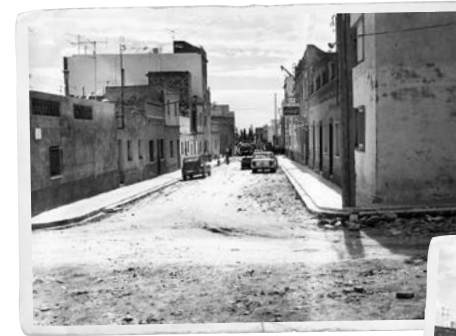
Imatge del carrer de València, a l'altura del carrer de Saragossa, abans de l'asfaltat de 1972.

I la tendència del barri era continuar creixent: “ara es justifica que s'estudiï la seva ampliació i limitació, que s'expandeixi als terrenys situats més a l'est, aptes per a l'edificació i amb uns límits molt precisos”, s'argumentava en el Pla Parcial del Tacó, que si bé regulava les condicions urbanístiques de l'ampliació del barri, no va implicar reformes en les edificacions i carrers ja consolidats.