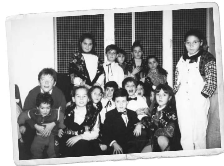
Algunes de les activitats del Centre Cívic al desaparegut pati interior que hi havia abans de l'ampliació.