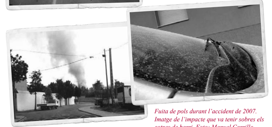
Fugida de pols durant l'accident de 2007. Imatge de l'impacte que va tenir sobres els cotxes de barri.