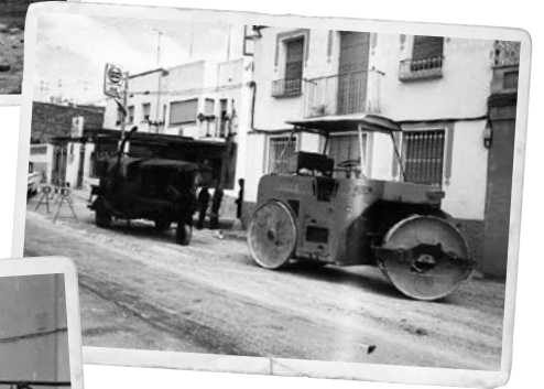
Els treballs d'urbanització dels carrers, l'any 1972. Imatges del carrer de Sevilla.