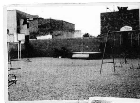
Antiga plaça de la Cucanya

L'any 2008 l'Ajuntament va impulsar un procés participatiu per consensuar amb el veïnat la remodelació del Parc del carrer de València, un espai emblemàtic del barri, per respondre una reivindicació històrica de l'Associació de Veïns (AV). Es van fer sessions de treball amb veïns i veïnes i també amb tècnics de l'Ajuntament es van implicar els diferents recursos i agents socials del barri (Espais Jove i d'Acció i ludoteca) i es van recollir un centenar d'enquestes. La nova plaça es va inaugurar el 20 de novembre de 2009.