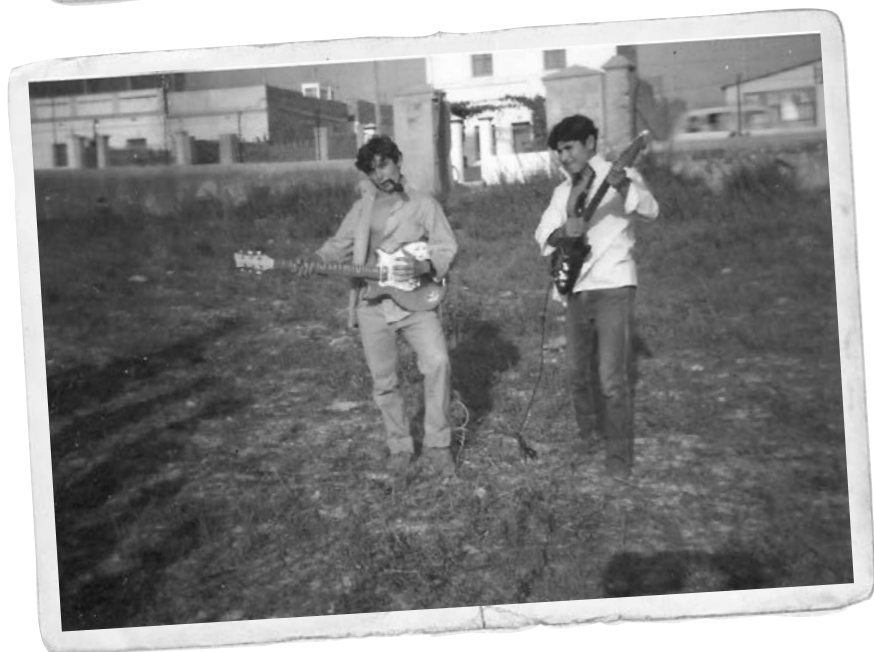
Imatges de la carretera de Vilafranca. A l'altura de l'actual Centre Cívic hi havia una de les portes del mur dels terrenys de Juncosa.