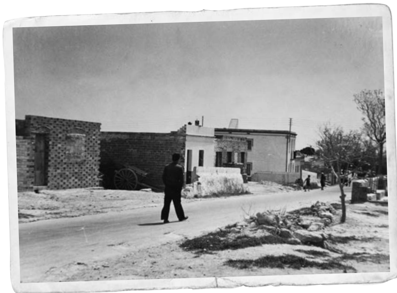
Imatge de la carretera de Vilafranca, entre els carrers de Saragossa i de Sevilla.

Per a les primeres construccions s'empraren adobs amb fang que assecaven al sol. Portaven l'aigua per a l'obra amb carros, a peu, amb cubells al cap, des de la sínia del Llimonet, a la qual s'accedia per una gran porta situada a l'actual carrer de les Casernes, entre el carrer del Llimonet i el Raval de Santa Magdalena.