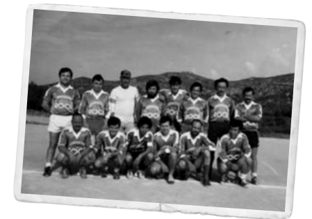
Equip de futbol del Club d'Amics del Tacó, als anys 80.