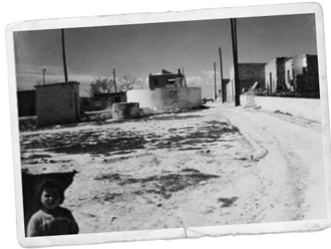
El pou del carrer de Sevilla.

Un dels protagonistes d'aquell moment va ser Pere Pérez, conegut com el practicant, que va aconseguir el cable per poder portar l'electricitat al barri, però allò no era suficient per tenir llum a casa. Va ser necessari convèncer uns quants veïns i el visticla de l'Ajuntament per poder dotar els habitatges d'una mínima xarxa elèctrica, abans i tot de la urbanització del barri als anys 60: “els cables van estar molts dies a casa, mentre anàvem aconseguint els diners per poder fer la instal·lació” , recordava Pérez. Un procés similar es va dur a terme amb la construcció de les primeres voreres.