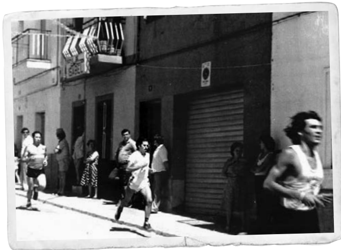
Una de les curses atlètiques de la Festa Major del barri, a finals dels anys 70