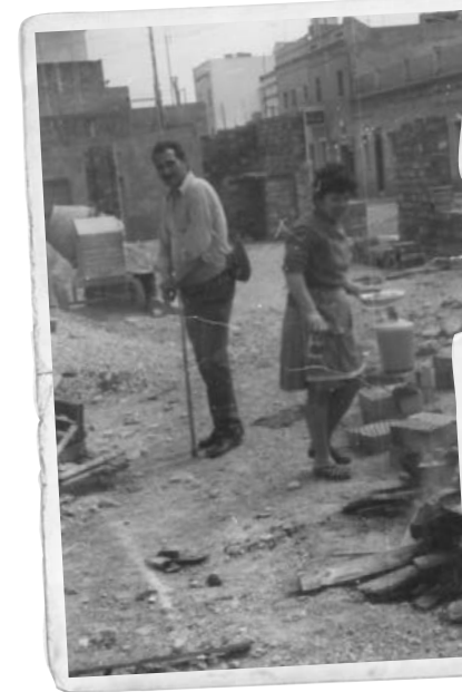
Els veïns van construir els habitatges en poc temps.