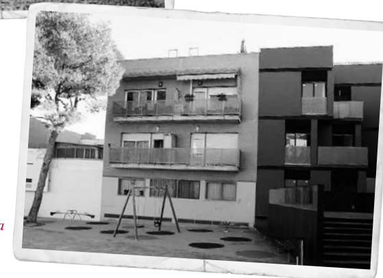
Actual plaça de la Cucanya