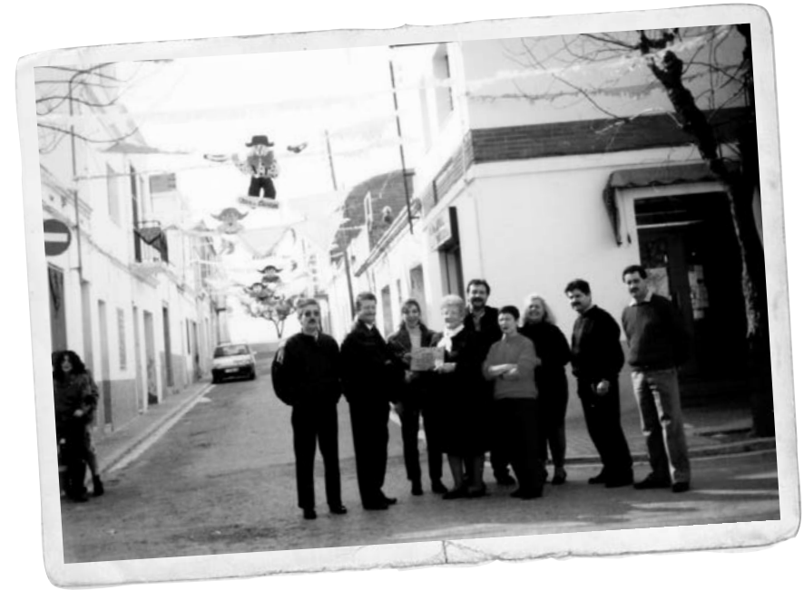
El carrer de la Fuensanta va guanyar el concurs d'engalanament de carrers del Carnaval del Tacó. Any 1991.

polítics i persones del barri que han destacat per alguna acció durant l'any anterior. Sota el nom de la Nit dels Òskars, el Tacó ha destacat en la programació del Carnaval vilanoví amb un acte nou, tot i que amb disset anys d'història.