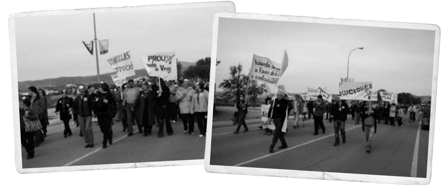
Escenes de les manifestacions veïnals contra la contaminació de la cimentera. Anys 2007 i 2008.

tenir lloc arran d'una avaria a la torre de ciclons del fons de la fàbrica, que va quedar obstruïda pel mateix material. La fugida de pols va durar uns cinc minuts, els suficients per enfarinar completament el barri i perquè les partícules arribessin a la major part de Vilanova i la Geltrú. De fet, a la plaça de la Vila va ser palpable la precipitació de partícules de pols de ciment.