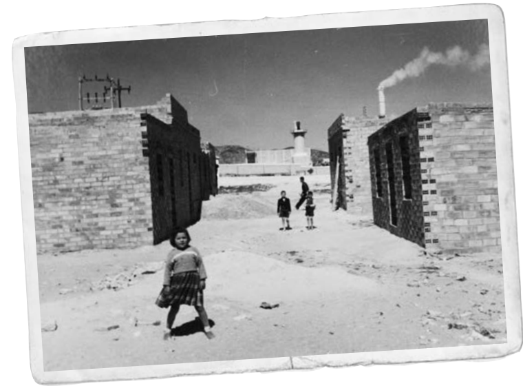
Imatge del carrer de València, entre els carrers de Saragossa i dels Crespellins.

La carretera de Vilafranca, arbrada amb uns plàtans que recorden pocs veïns, n'era l'itinerari. El barraquisme va existir en aquells inicis, i va evolucionar ben aviat cap a construccions humils, però més dignes.