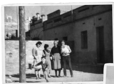
Veïns de la carretera de Vilafranca, a un dels patis de les cases.