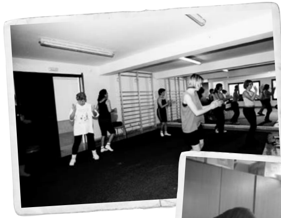
Classe de gimnàstica al Centre Cívic