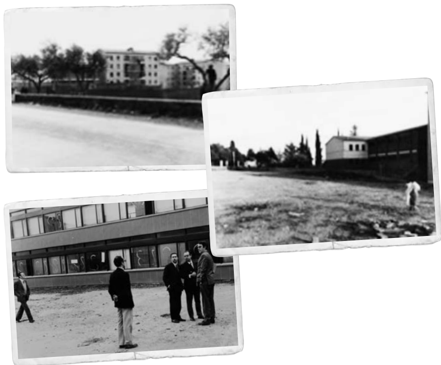
Els treballs de construcció de l'escola, entre el barri del Tacó i l'Armanyà.

“el extraordinario auge de la construcción en esta región es causa de que los precios en la misma sean muy elevados, más que los tipos establecidos en las subastas, y hace también que al haber abundancia de trabajo en obras privadas se resistan los contratistas a concurrir a subastas promovidas por el Estado o el Municipio”. En tot cas, l'any 1965, els responsables municipals ja manifestaven la seva preocupació pel problema escolar a la zona i reconeixien que aquell projecte redactat set anys abans havia quedat obsolet per la construcció del Grup Armanyà i el creixement constant del Tacó. De fet, un any després, l'escola del Tacó ja era una realitat.