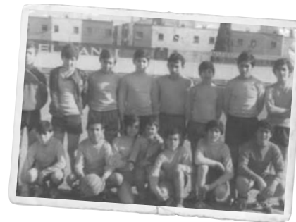
Equip de futbol amb veïns del barri, als anys 70.

La pràctica del futbol ha estat i continua sent una bona eina de cohesió, també en el cas de la nova immigració. No fa gaires anys s'havien celebrat diversos partits i lliguetes amb un clar exemple de bona pràctica social, amb una gran participació de membres de diversos orígens, principalment de l'Àfrica Negra.