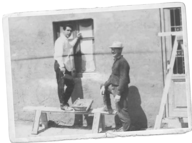
Escena de la construcció d'un habitatge a càrrec dels mateixos veïns.