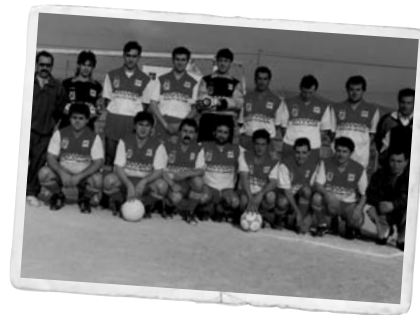
L'equip de futbol del barri, a mitjans dels anys 90.