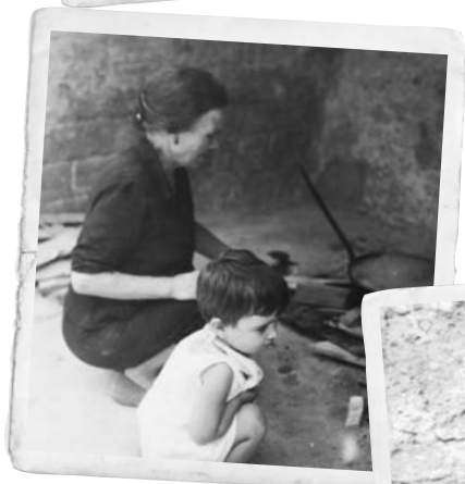
Escenes familiars del veïnat.