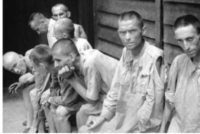
Supervivents del camp de Gusen. 1945.