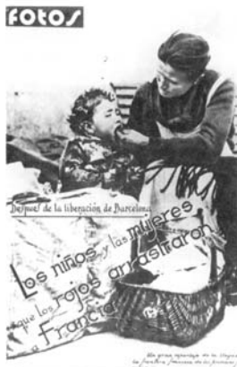
Fotos, semanario gráfico nacionalsindicalista. 1939.

Vam anar a parar a un camp de concentració que estava molt pitjor... era terrible... però d'allà em vaig poder escapar... El meu marit ja era a París, i em van ajudar... Era una època en que els diaris a París hi podies escriure i posar anuncis de manera gratuïta i això facilitava que la gent es pogués trobar i connectar... Jo estava sola perquè les meves amigues van seguir a Bretanya i jo em vaig quedar a Bordeus perquè la meua filla estava tan malalta que em van fer baixar... però mai estàs sola, perquè la gent t'ajuda. Gent que no coneixes de res, però que totes estàvem pel mateix i els sentiments ens ajuden a sobreviure.