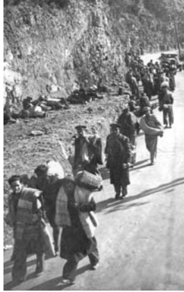
Republicans passant el Portús. 1939.

da potser misèria... ni jo a la seva, però aquella mirada va marcar el meu destí... Sinó potser hagués anat a un camp, a Argelès, com el meu pare... o hagués tornat a Vilanova, no ho sé.