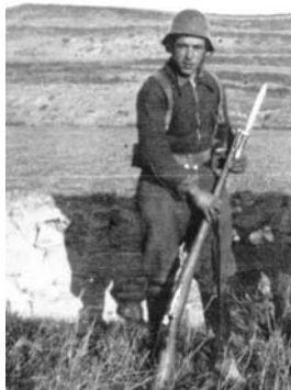
Durant la guerra a Alcubierre.

Ens van robar la joventut, el 8 anys més importants de la vida... Això no ho recuperes mai.