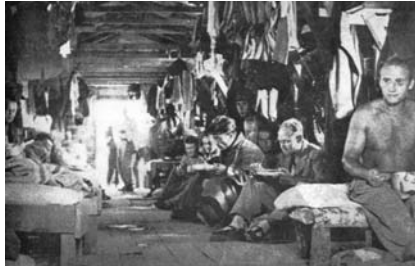
Interior d'un pavelló al camp de Gurs.

Vam anar a parar a un camp de concentració que estava molt pitjor... era terrible... però d'allà em vaig poder escapar... El meu marit ja era a París, i em van ajudar... Era una època en que els diaris a París hi podies escriure i posar anuncis de manera gratuïta i això facilitava que la gent es pogués trobar i connectar... Jo estava sola perquè les meves amigues van seguir a Bretanya i jo em vaig quedar a Bordeus perquè la meua filla estava tan malalta que em van fer baixar... però mai estàs sola, perquè la gent t'ajuda. Gent que no coneixes de res, però que totes estàvem pel mateix i els sentiments ens ajuden a sobreviure.