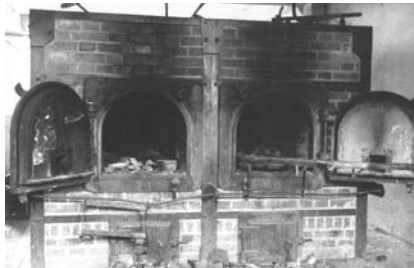
Crematoris del camp de Mauthausen. 1945.

Per menjar: un tros de pa i una mena de botifarra al matí, i quan tornaves de treballar al vespre un plat de sopa de naps o de naps podrits i quan et cridaven havies de córrer, l'últim sempre se la carregava, sense camisa i sense res, aigua glaçada, garrotada.