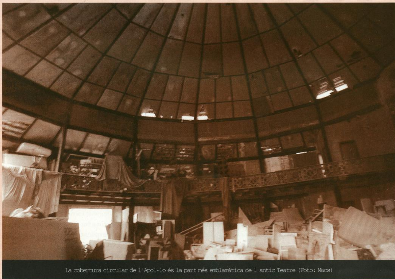
La cobertura circular de l'Apol·lo és la part més emblemàtica de l'antic Teatre