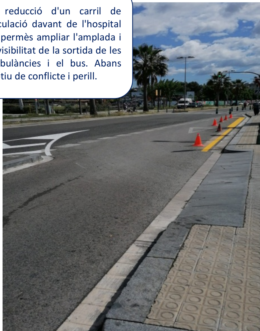
Millora de l'accés a l'hospital

La reducció d'un carril de circulació davant de l'hospital ha permès ampliar l'amplada i la visibilitat de la sortida de les ambulàncies i el bus. Abans motiu de conflicte i perill.