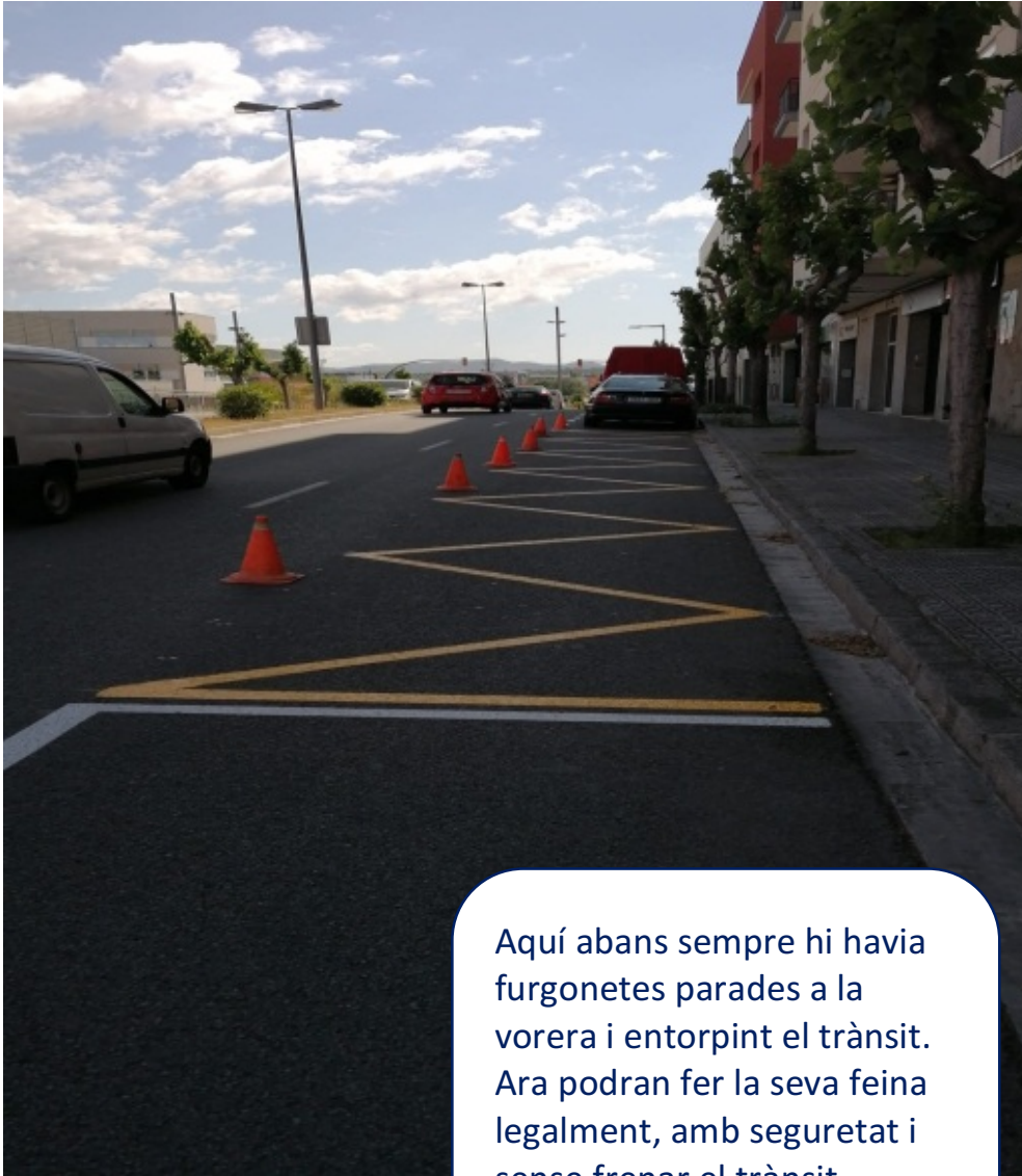
Zones de càrrega i descarrega

Aquí abans sempre hi havia furgonetes parades a la vorera i entorpint el trànsit. Ara podran fer la seva feina legalment, amb seguretat i sense frenar el trànsit.