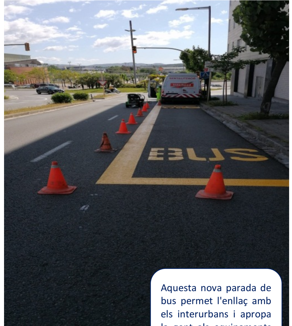
Parada de bus

Aquí abans sempre hi havia furgonetes parades a la vorera i entorpint el trànsit. Ara podran fer la seva feina legalment, amb seguretat i sense frenar el trànsit.