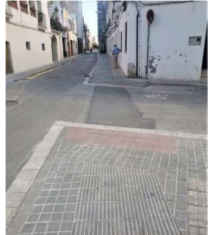
Creuament amb St. Cristòfol ↑ C. Sitges amb Unió ↓