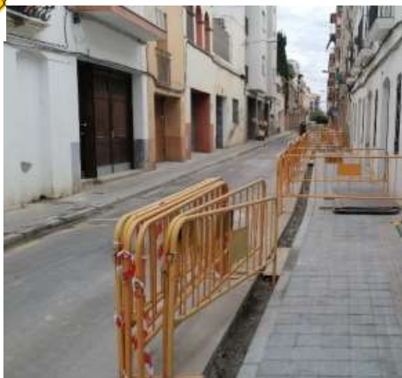
Col·locant la rigola que canalitza l'aigua ↓ ↑