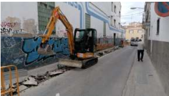
Obrint la rasa ↑