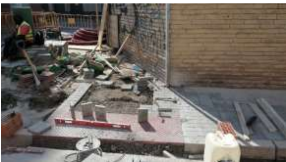
Col·locant el panot amb botons que facilita l'accessibilitat a persones cegues o amb visió reduïda ↑