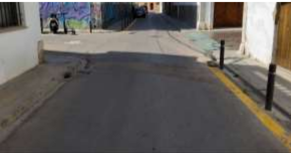
C. de Sitges amb c. de Sant Cristòfol ↓