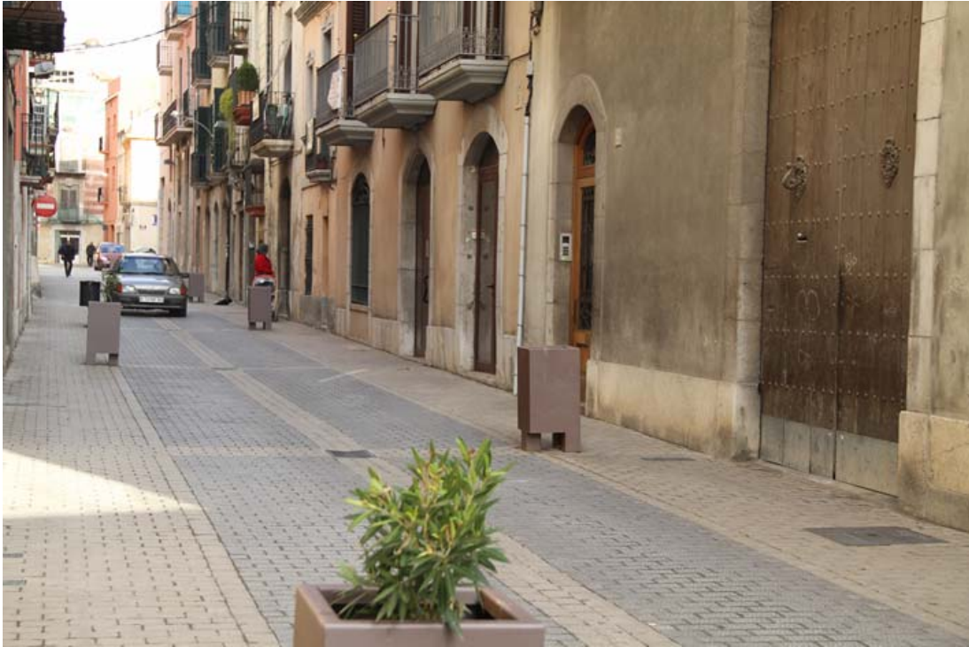
La reurbanització de carrers, pas previ a la implantació del pla de pacificació.