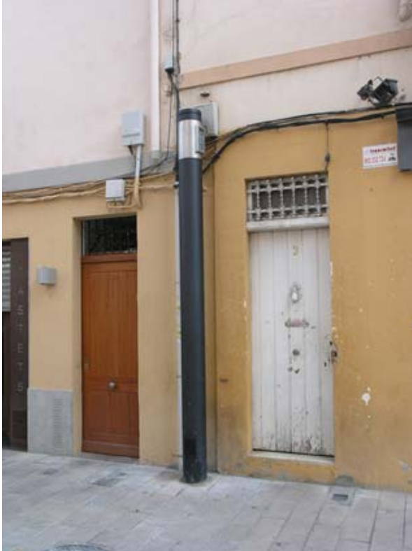
Control fotogràfic a la pl. de Miró de Montgròs