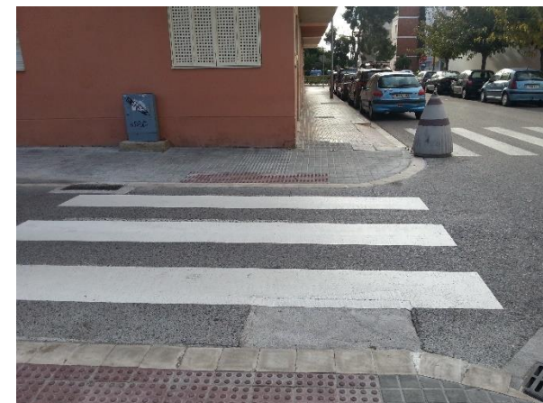
cruïlla amb c. de Joan Llaveries