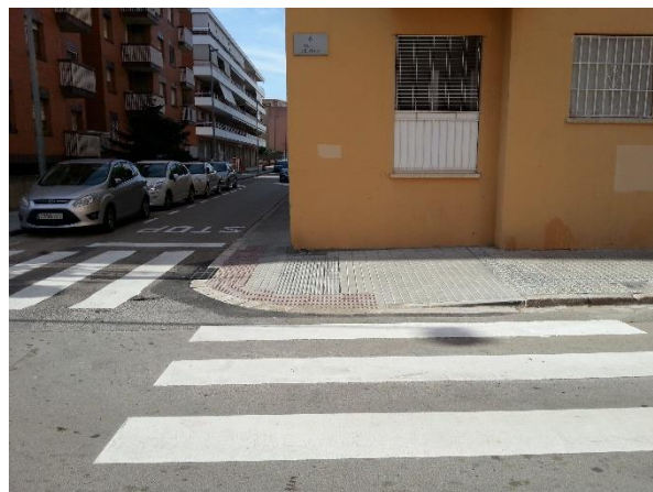
cruïlla amb c. de Greco