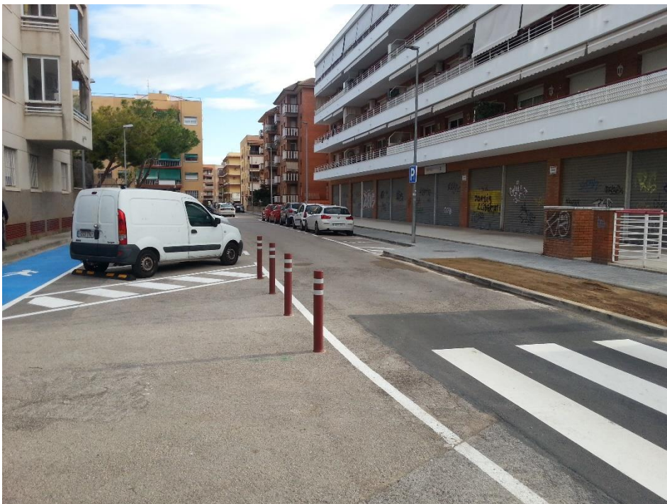
Reordenació dels aparcaments i de l'espai d'ús dels vianants