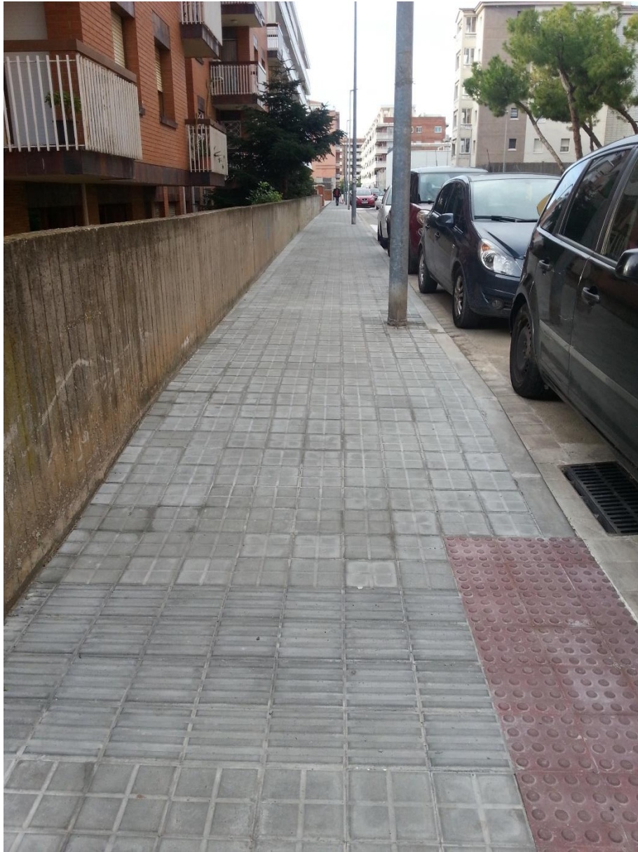
Ampliació de la vorera sud i desplaçament de fanals