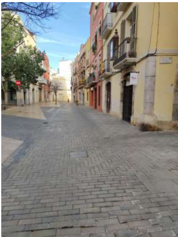
Fotografies abans de l'obra ↓