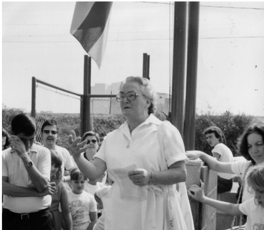
Inauguració nova escola. 1982

Cooperativa de Pares i Mestres i es van demanar 40.000 pessetes a les famílies per finançar les obres. Al començament del curs 1982-83, i després de molts esforços i dedicació de pares i mestres, obre les portes la nova Escola Llebetx, que aplega sota un mateix sostre totes les classes i serveis que durant anys havien funcionat separatament entre les aules del carrer Sant Gervasi i de l'edifici de Can Pahissa.