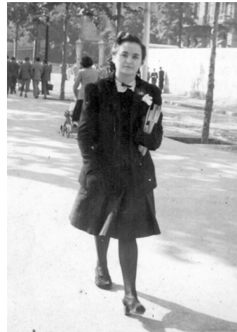
Sortint de la Universitat. 1943