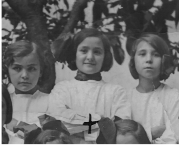
Amb alumnes de l'Escola del Roser. 1933