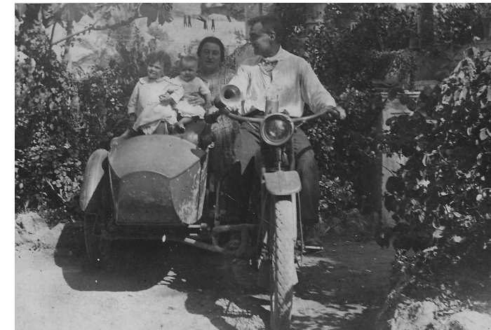
1924 Amb els pares i la germana gran, dalt la Harley-Davidson de la família.

Els avions s'allunyaren i el brogit del motors es va perdre en l'espai infinit”.