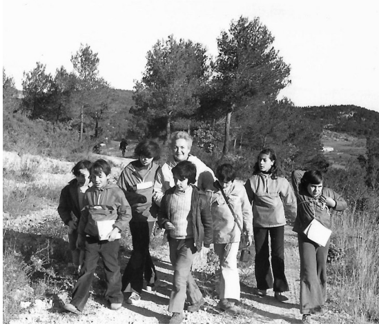
Colònies d'hivern a la Casa de Colònies de Penyafort. 1974