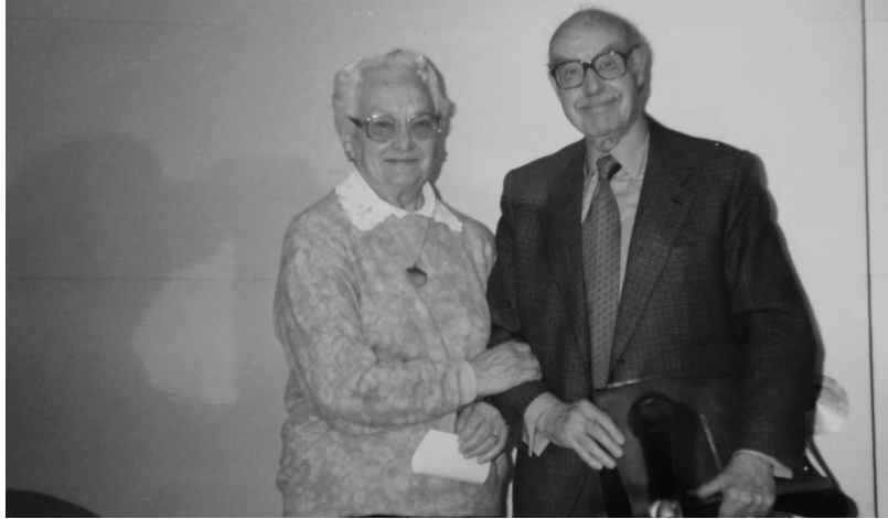
Relleu a la presidència de l'Agrupació d'Aules de Formació Permanent per a la Gent Gran (AFOPA). 2001