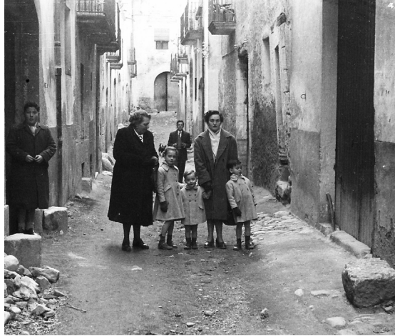
La Selva del Camp. 1953