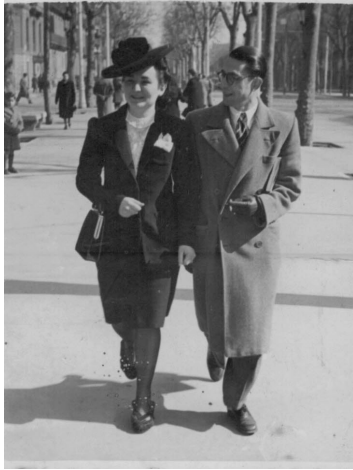
Passejant per la Gran Via. 1944.