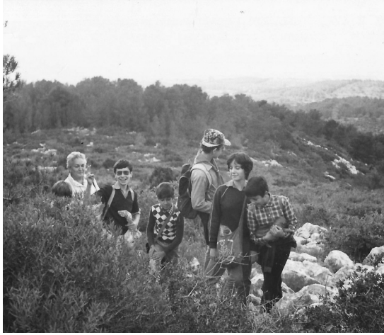
Puig Montgròs. 1980