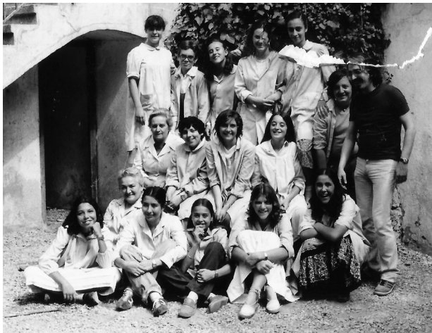
Classe de 8è. 1980

del “Restaurant Marina” i, com que tampoc teníem telèfon, jo havia de sortir cada dia un moment de l’escola per trucar des de la cabina del Parc Samà i poder dir al Santi, el propietari, quants menús havia de preparar-nos, un cop tenia la llista dels nens que es quedaven a menjar”.