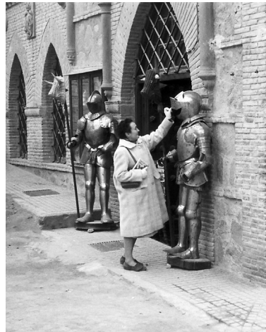
A Toledo. 1958