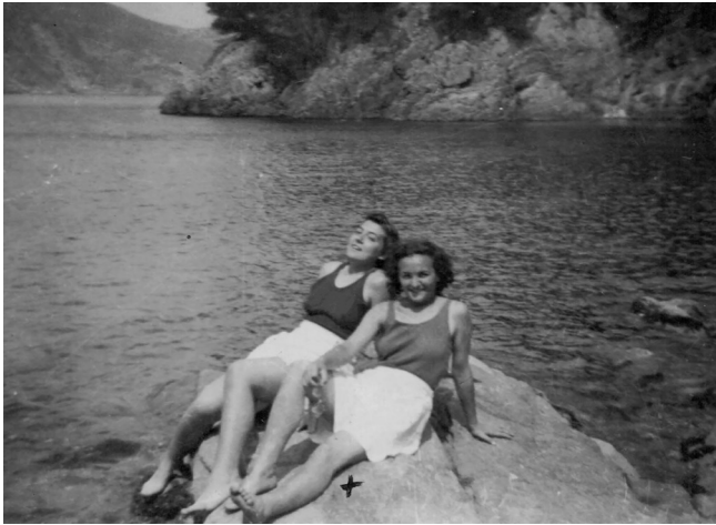
Begur, agost 1942

Barcelona. Ràfols va simultaniejar durant una etapa les tasques de delegat de “Prensa y Propaganda” amb les de delegat d’“Información y Turismo”.