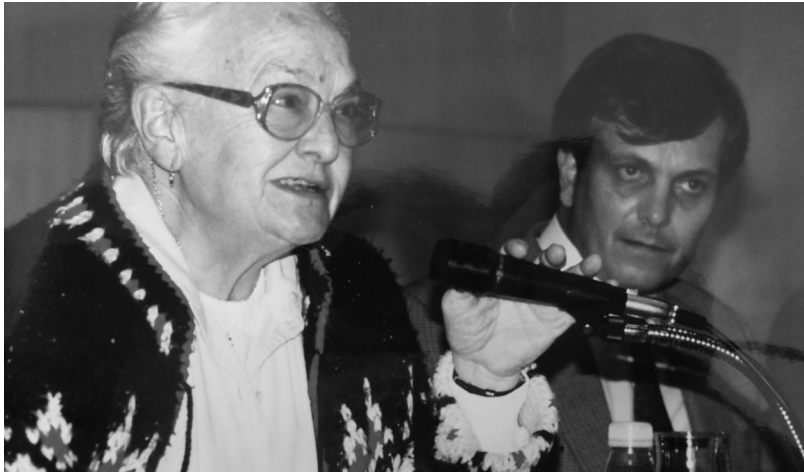
Inici de curs. 1997