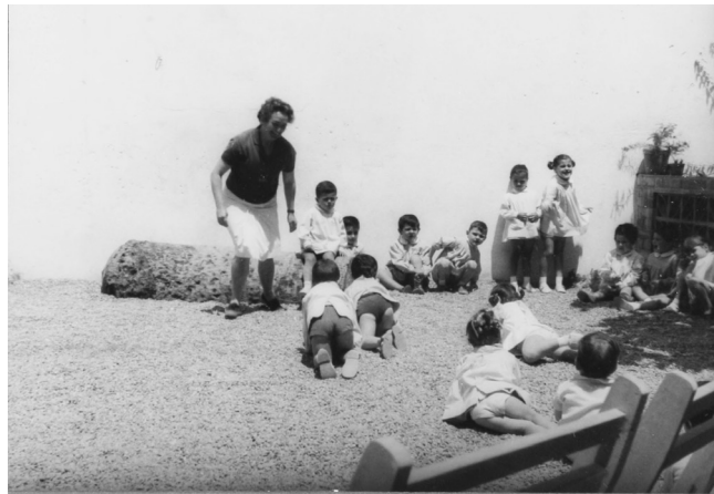
Pati del carrer Sant Gervasi. 1969