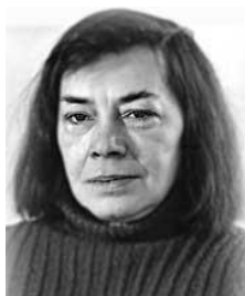
Patricia Highsmith a la Xarxa de Biblioteques