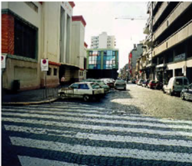
Estat actual de l'avinguda de Francesc Macià davant del Mercat del Centre

Es preveu que l'execució de les obres s'iniciï a principis de 2006. L'actuació urbanística comportarà elaborar una previsió per fer compatibles les tasques de reurbanització amb el pas de vehicles i l'ús mercat per part de paradistes i clients.