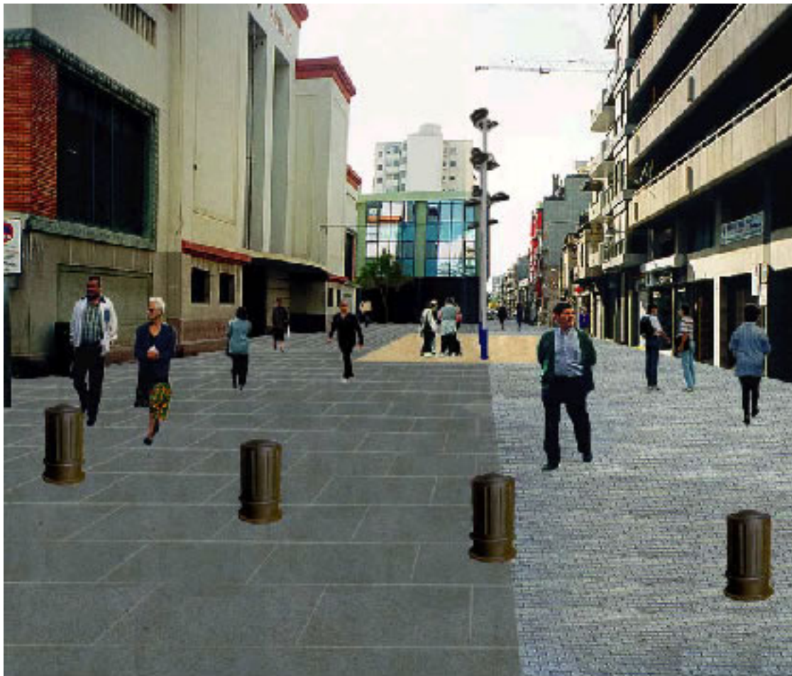
Imatge virtual de l'avinguda de Francesc Macià davant del Mercat del Centre, segons l'aplicació del projecte de reurbanització.