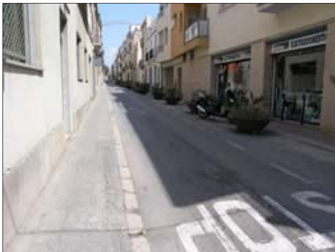
Estat actual del carrer del Correu.